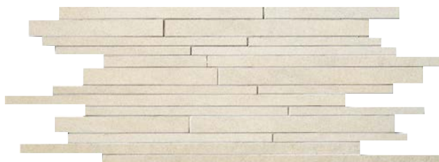
QU361MS White (A) SQM/871