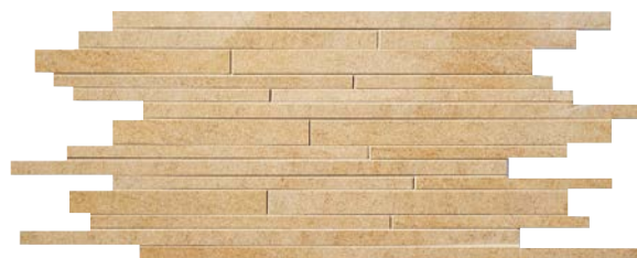
QU363MS Sand (A) SQM/863