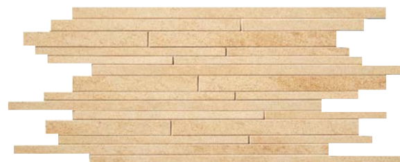
QU364MS Rose (A) SQM/863