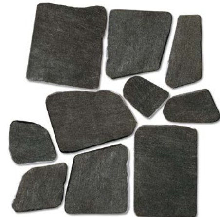
QU7PDA Palladiana Black SQM/622