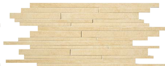
QU362MS Beige (A) SQM/863