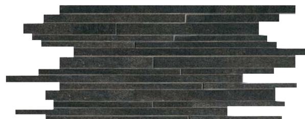
QU367MS Black (A) SQM/871