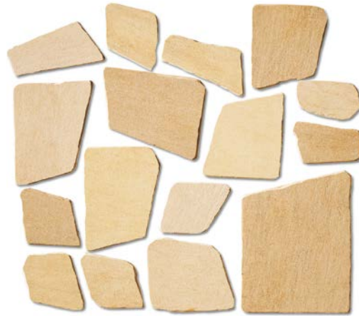
QU24PDA Palladiana Mix SQM/622

Textured/Tumbled - Strukturiert/Getrommelt - Structuré/Buriné - Структурированный/Галький