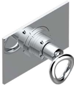
G4P.5100B.A02 Garniture pour mitigeur thermostatique THG, réf. 5200AE Trim for THG thermostat ref. 5200AE