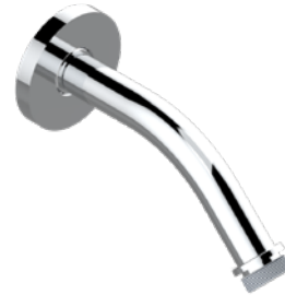
G4P.82.A02 Bras pour pomme de douche long. 120 mm coudé à 45° Wall mounted shower arm, length: 120 mm, 45°