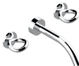
G4P.40G.A02 Mélangeur de lavabo 3 trous mural, sans vidage Wall mounted 3-hole basin mixer, no waste