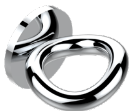
G4P.30B.A02 Garniture pour robinet d'arrêt réfs. 30 & 32 Trim only for wall valve refs. 30 & 32