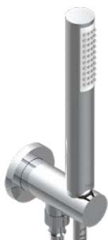
G4P.54.A02 Ensemble sortie, flexible et douchette Wall mounted handshower, hose and elbow with rest