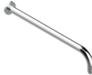
G4P.84L.A02 Bras pour pomme de douche long. 450 mm coudé à 90° Wall mounted shower arm, length: 450 mm, 90°