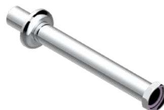
G00.311.A02 Tubulure 300 mm droite avec rosace 300 mm overflow pipe