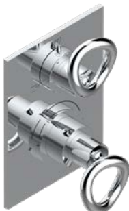
G4P.5500BE.A02 Garniture pour mitigeur thermostatique THG avec inverseur 2 sorties réf. 5500AE avec boîtier d'encastrement Trim for THG thermostat with 2 way diverter ref. 5500AE with box for rough parts