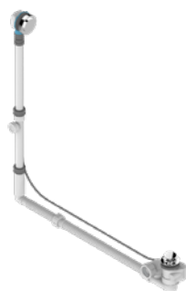
G4P.302GM.A02 Vidage de baignoire réglable, modèle Geberit européen 150.617.001 Geberit bath waste, European model 150.617.001