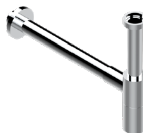
G00.309/S.A02 Siphon design apparent Trap only for waste