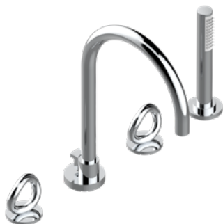
G4P.112BSG.A02 Mélangeur bain-douche 4 trous Rim mounted 4-hole bath-shower mixer