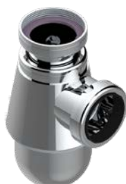
G00.308.A02 Siphon culot réglable mini 45 mm maxi 90 mm Adjustable bottle trap, mini 45 mm maxi 90 mm