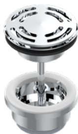
G00.309/B.A02 Bonde pour vidage de lavabo pour vasque sans trop-plein Slow running basin waste