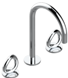
G4P.151.A02 Mélangeur de lavabo 3 trous avec vidage Rim mounted 3-hole basin mixer and pop-up waste