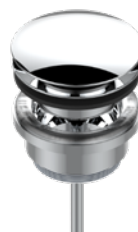
G00.316.A02 Vidage de lavabo clic-clac Click-clac pop-up waste