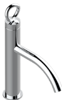
G4P.6501B.A02 Mitigeur de lavabo avec vidage Single lever basin mixer and pop-up waste