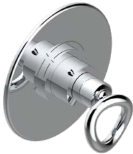
G4P.5100BR.A02 Garniture pour mitigeur thermostatique THG, réf. 5200AE - modèle avec plaque ronde Trim for THG thermostat ref. 5200AE - round plate model