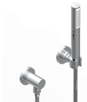
G4P.52.A02 Ensemble douchette, flexible, sortie et crochet fixe Wall mounted handshower, hose, fix hook and elbow