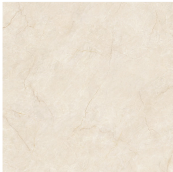
COSTA MARFIL PULIDO