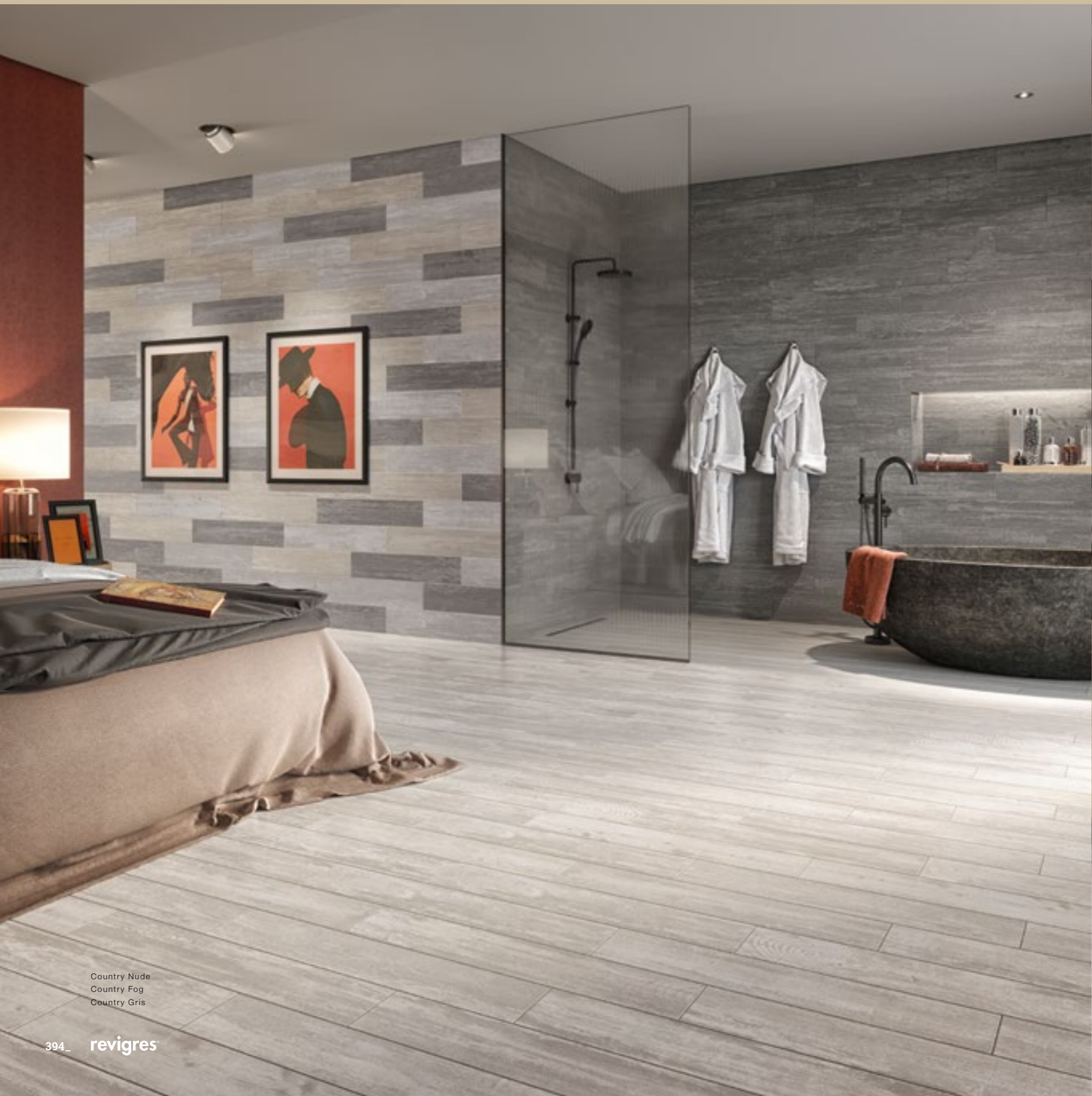
Country Nude Country Fog Country Gris

O efeito envelhecido e rústico da madeira, para ambientes sofisticados e aconchegantes. The aged and rustic effect of wood for sophisticated and cosy environment. L'effet vieilli et rustique du bois, pour des environnements sophistiqués et accueillants. El efecto envejecido y rústico de la madera, para ambientes sofisticados y acogedores.