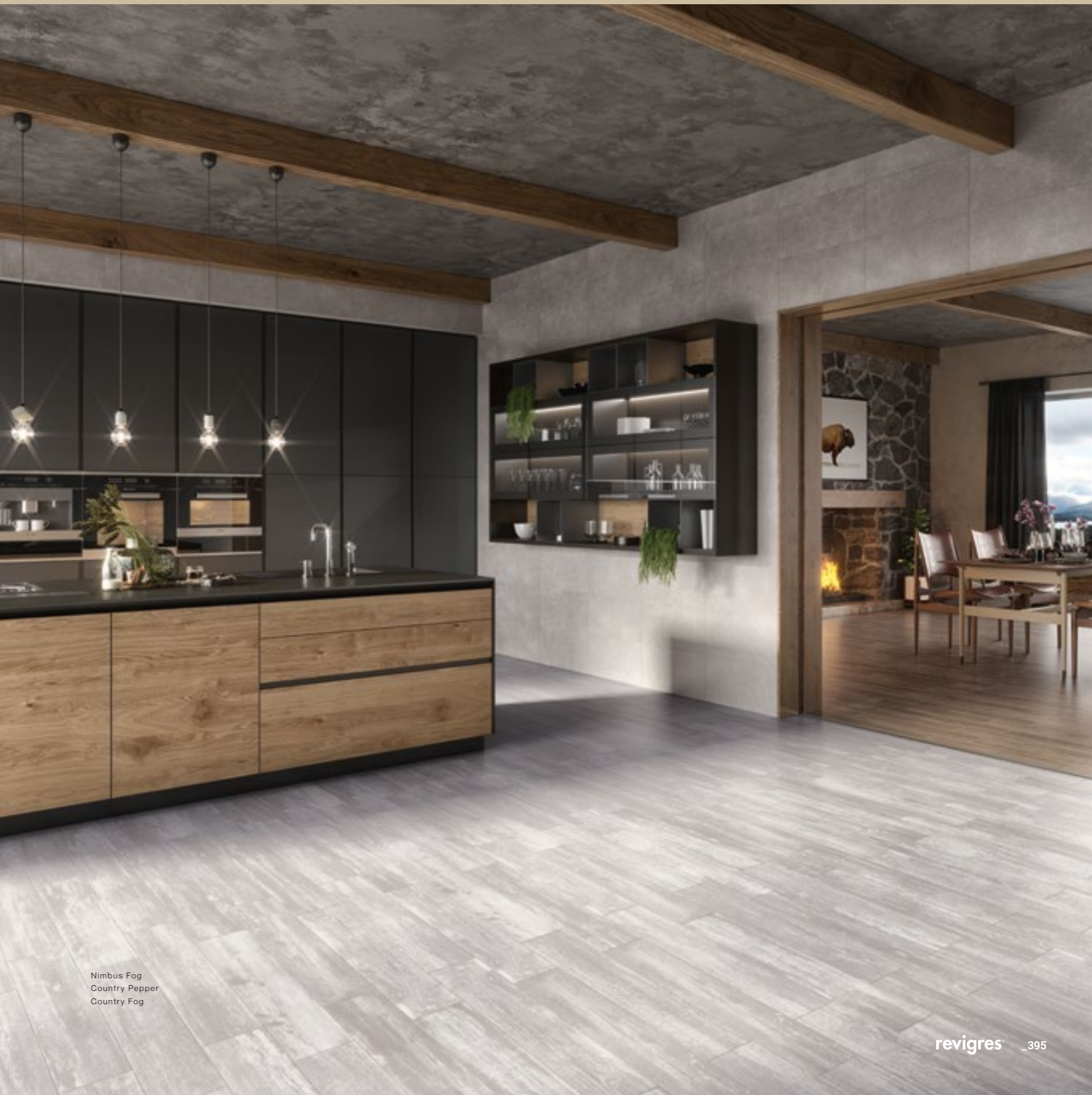
Nimbus Fog Country Pepper Country Fog