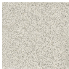
CROACIA BASE PERLA