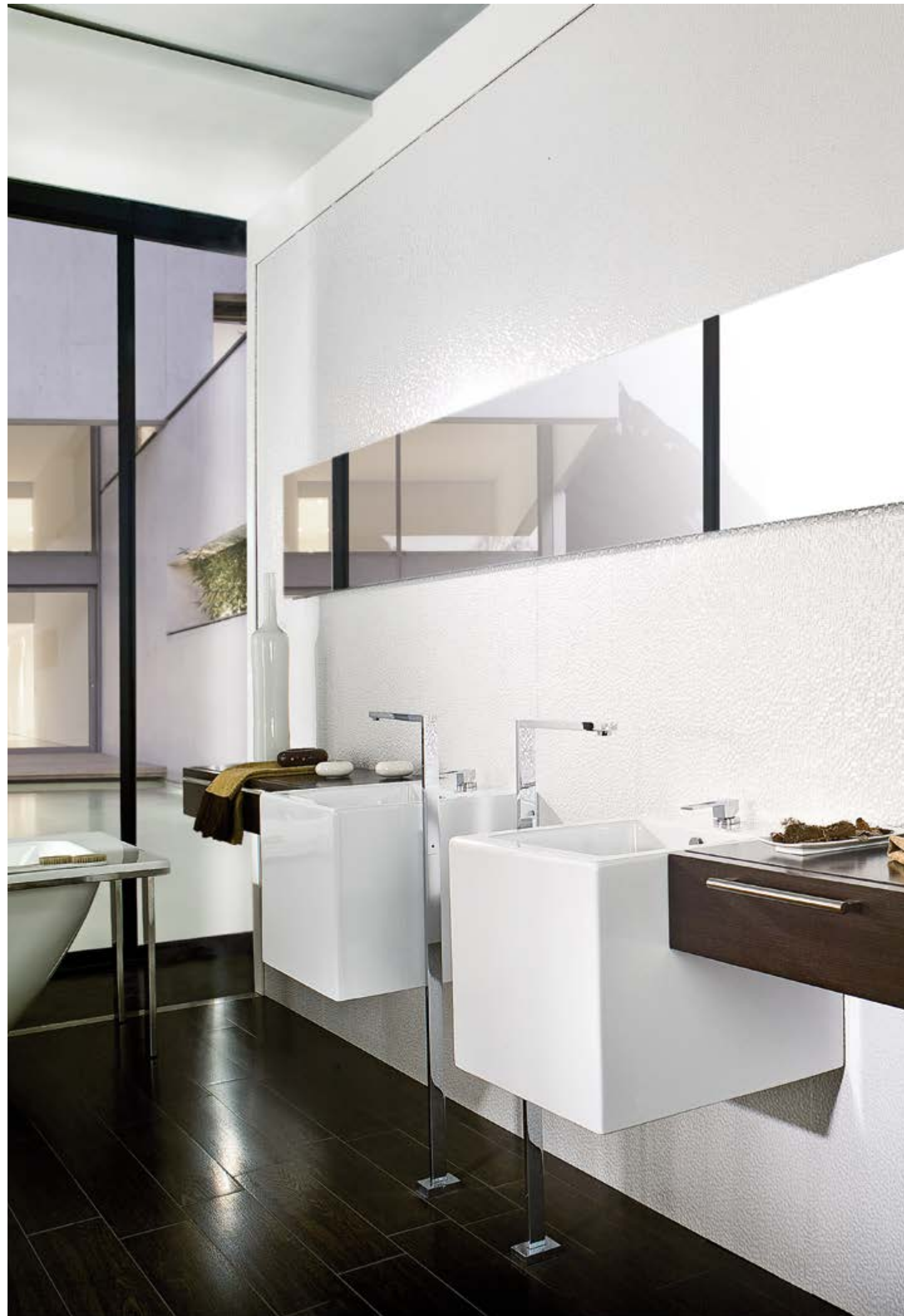
CUBICA BLANCO 33,3 cm x 100 cm