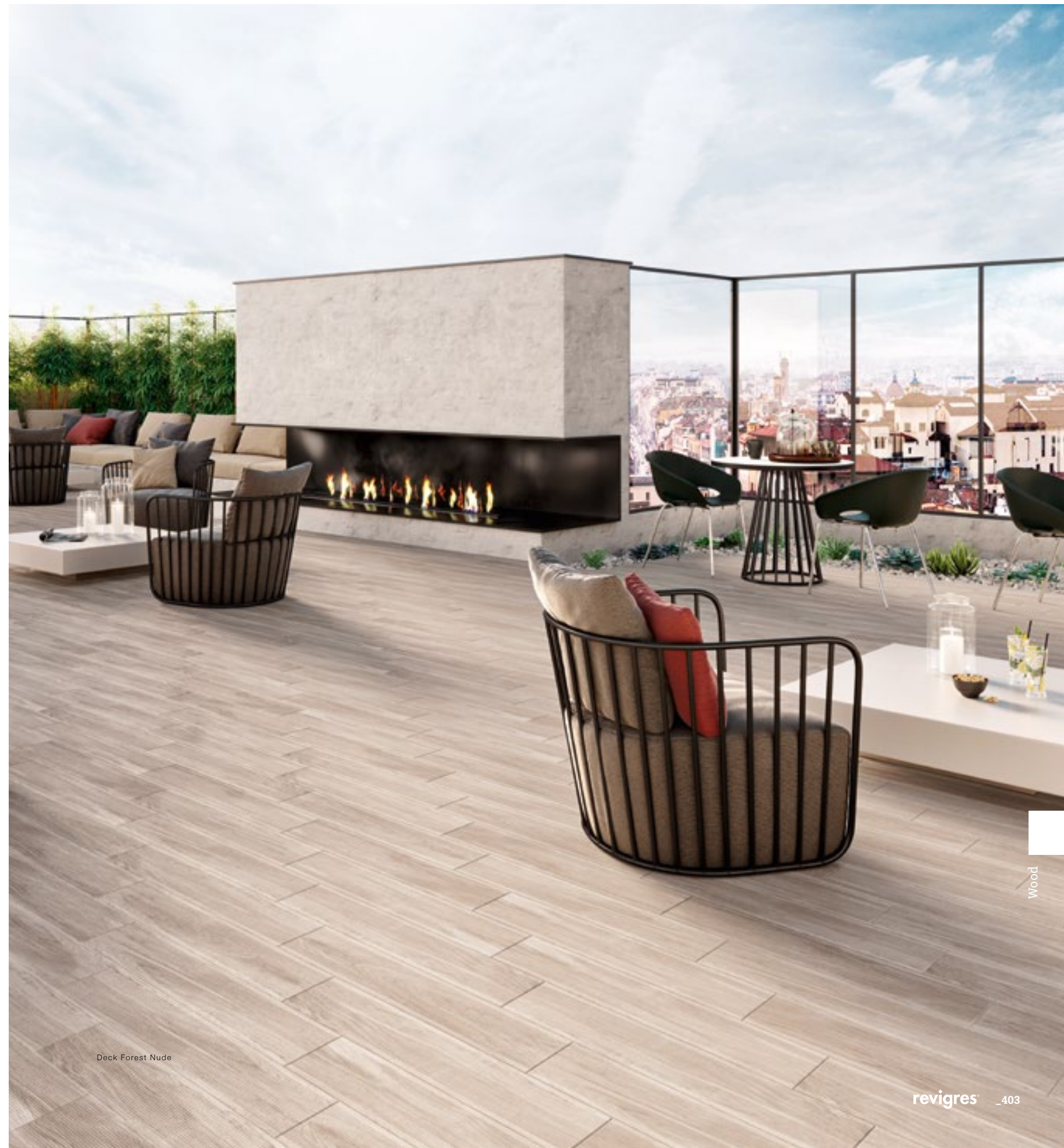
Deck Forest Nude