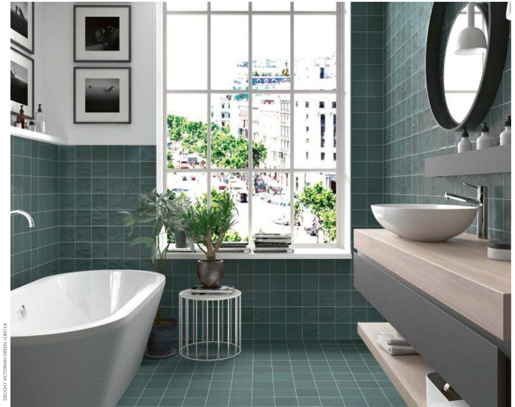
DELIGHT VICTORIAN GREEN 13,8X13,8.

For more technical information, specifications and images, visit our website. The packing of our items is subject to variations, to get the most accurate and updated information we recommend to check the website. Para más información técnica, especificaciones e imágenes visite nuestra web. El embalaje de los artículos está sujeto a variaciones, para obtener el dato exacto y actual se recomienda consultar la web.