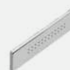
8034B+8034A Soffione laterale. Lateral body spray. Pomme de douche latérale. Seitenkörperbrause. Jet lateral.

Finiture/ Finishing/ Finitions/ Oberfläche/ Acabado 02