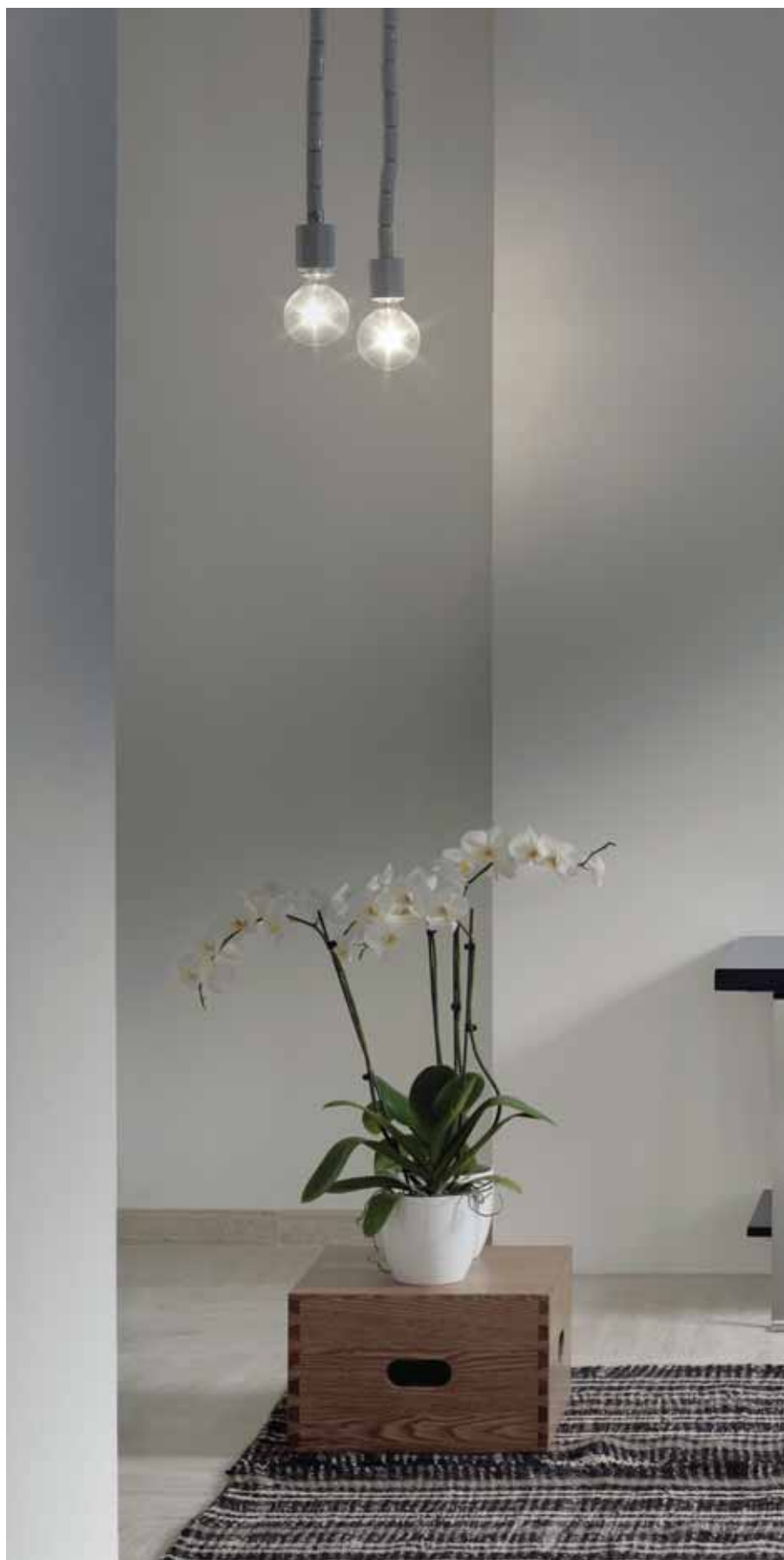
Doppio Zero _ Fango art. DZ46L - ø 46 x h 14 cm

Eklektisch und originell, Doppio Zero ist ein bisschen Pop, aber auch konzeptionelle Poetik des Ready-made. Eine Kuchenform aus Keramik, die entsprechend vergrößert zu einer Waschschiüssel wird, deren Wellen des florealen Profils Schatten erzeugen, die das zerbrechliche Material der Keramik betonen.