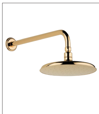
Ref. U5D.84L + 286

Pomme de douche Ø 200 mm et bras mural Wall mounted shower head Ø 200 mm / 8" and arm