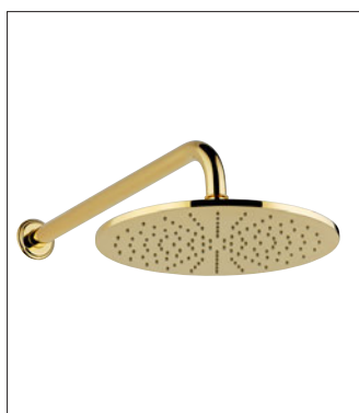
Ref. U5H.84L + 280EP

Mélangeur de lavabo 3 trous Rim mounted 3-hole basin mixer