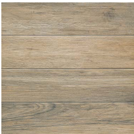
59,5x59,5 - 23"7/16x23"7/16 EDM 56RT Castagno