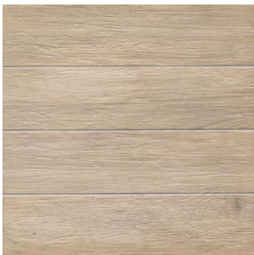
59,5x59,5 - 23"7/16x23"7/16 EDM 36RT Miele