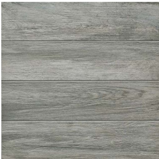
59,5x59,5 - 23"7/16x23"7/16 EDM 26RT Sandalo