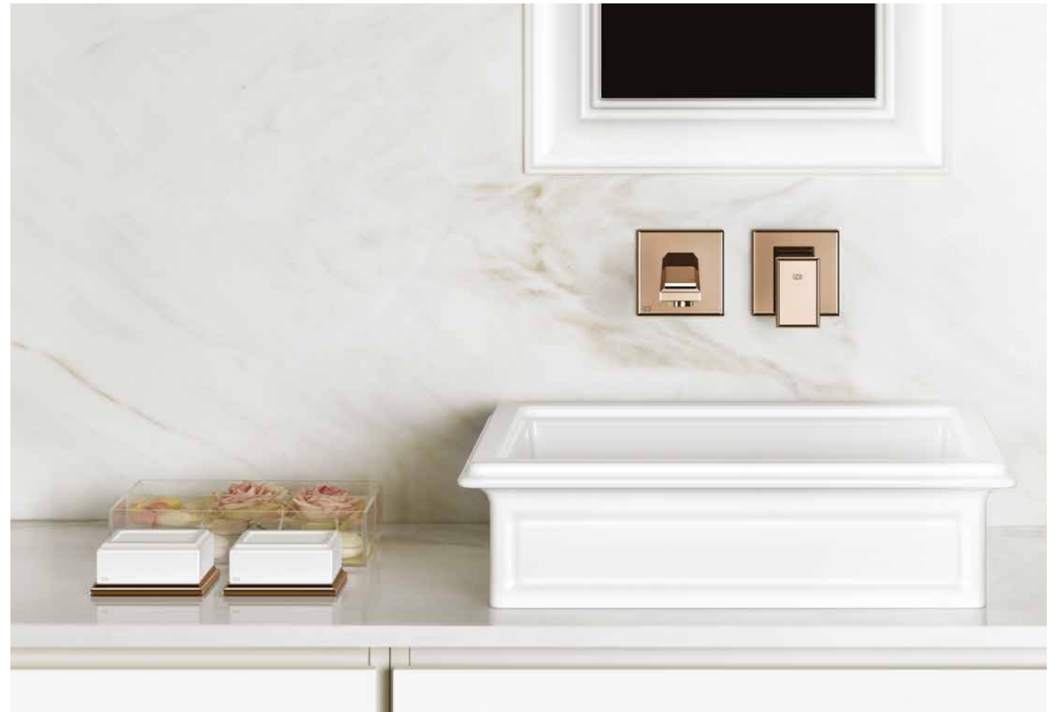
46112_46106#030 Built-in mixer / Miscelatore ad incasso

Se la raffinatezza va scoperta nella cura dei particolari, i dettagli di grande finezza della Collezione Eleganza rivelano la maestria dei suoi designer e realizzatori. L'insieme degli studiati tratti del design rende prezioso ogni ambiente bagno, creando un'atmosfera di stile e charme, ma è la maestria, l'alta sperimentazione e l'innovatività di inedite tecniche produttive, unite alla riscoperta di antiche esperienze di fonderia, che si pongono alla base del compimento delle forme piene di grazia di questi oggetti di grande bellezza.