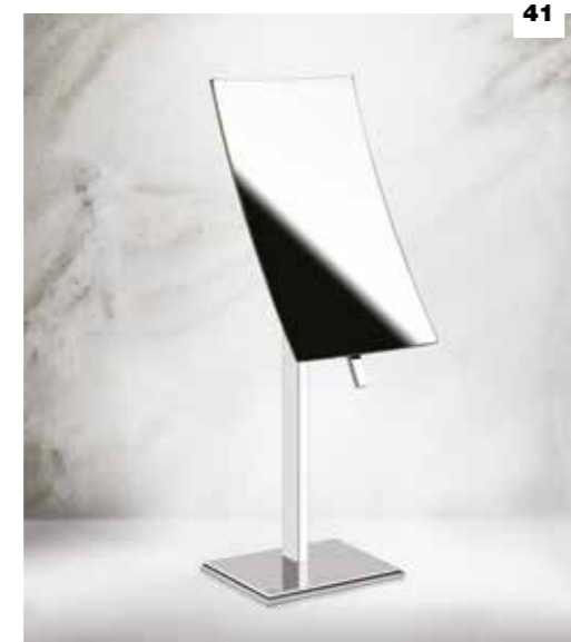
41. 46588 ADJUSTABLE STANDING MIRROR / SPECCHIO D'APPOGGIO A LENTE ORIENTABILE