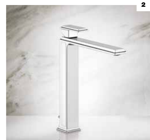
2.46003 HIGH VERSION BASIN MIXER, WITH WASTE / MISCELATORE MONOCOMANDO LAVABO ALTO, CON SCARICO 46004 WITHOUT WASTE / SENZA SCARICO