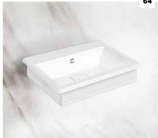
64. 46811 WALL-MOUNTED OR COUNTER WASHBASIN IN CRISTALPLANT® (MATT WHITE). INSTALLATION ON 46821/ LAVABO SOSPESO O DA APPOGGIO IN CRISTALPLANT® (BIANCO OPACO). INSTALLAZIONE SU 46821 46812 EXTERNAL LACQUERING / VERNICIATURA ESTERNA