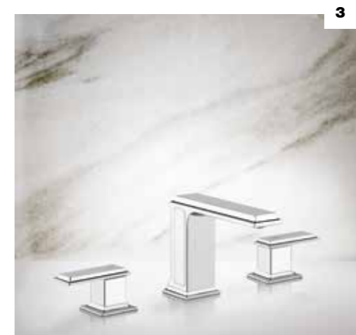
3. 46011 THREE-HOLE BASIN MIXER WITH SPOUT, WITHOUT WASTE / GRUPPO LAVABO TRE FORI CON BOCCA, SENZA SCARICO 46012 WITH WASTE / CON SCARICO