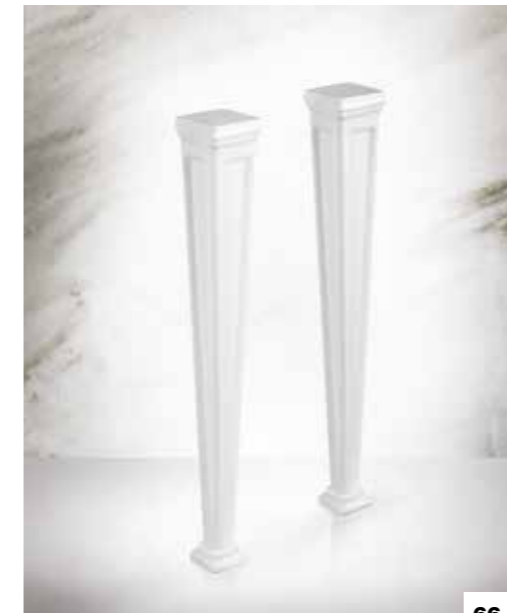
66. 46817 SET OF LEGS WASHBASIN IN CRISTALPLANT® (MATT WHITE) / GAMBE IN CRISTALPLANT® (BIANCO OPACO) 46819 EXTERNAL LACQUERING / VERNICIATURA ESTERNA