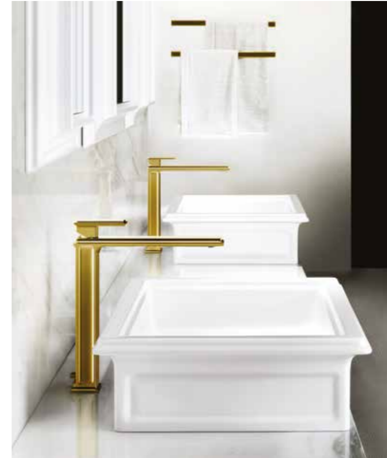
46001#031 Basin mixer with waste / Miscelatore monocomando lavabo, con scarico