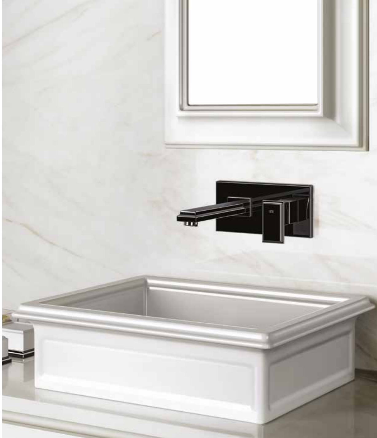
44697_46088#706 Built-in basin mixer with spout, without waste / Miscelatore lavabo ad incasso con bocca, senza scarico