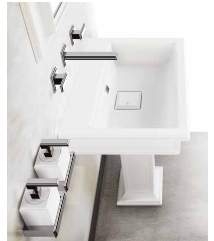
45089_46090#031 Built-in three-hole basin mixer with spout, without waste / Gruppo lavabo tre fori ad incasso con bocca, senza scarico

L'universo dell'eleganza, per mezzo di arredi, oggetti, atmosfere, si dispiega in stanze da bagno capaci di sorprendere e coinvolgere emotivamente: ambienti nei quali immaginare il modo in cui si desidera vivere secondo una personale idea di stile. Una allure da realizzare come nella scelta di un sapiente accostamento di abito e accessori, modificando lo spazio oltre il sogno con una moltitudine di elementi diversamente declinabili. Un mondo articolato di bellezza che consente di esprimere il proprio gusto ricercato anche nell'abitare.