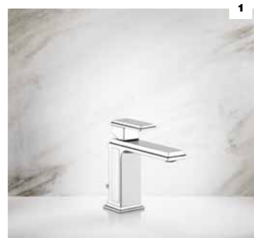
1. 46001 BASIN MIXER WITH WASTE / MISCELATORE MONOCOMANDO LAVABO, CON SCARICO 46002 WITHOUT WASTE / SENZA SCARICO