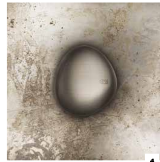
4. 52002 HANDLE / MANIGLIA