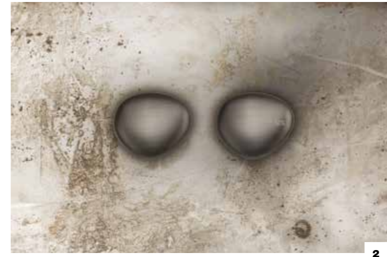
2. 52012 SET OF HANDLES / COPPIA DI MANIGLIE