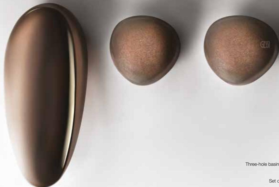
52011#030 Three-hole basin mixer / Gruppo lavabo tre fori