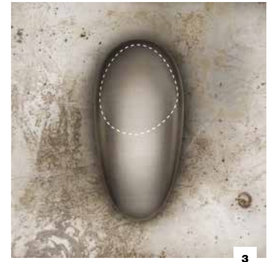
3. 52001 BASIN MIXER/ MISCELATORE MONOCOMANDO LAVABO