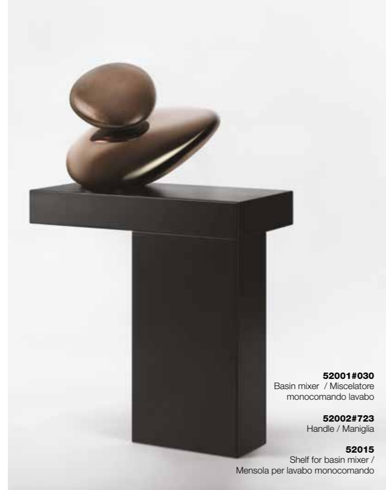
52001#030 Basin mixer / Miscelatore monocomando lavabo

Il tocco dell'oggetto, nel suo utilizzo quotidiano, comunica l'energia che le sue forme in equilibrio imprigionano; la naturale vitalità dell'acqua, che vi sgorga come da una fonte, trasmette benessere. Per non dissipare l'energia, essa è concentrata in un pezzo unico dal valore iconico.