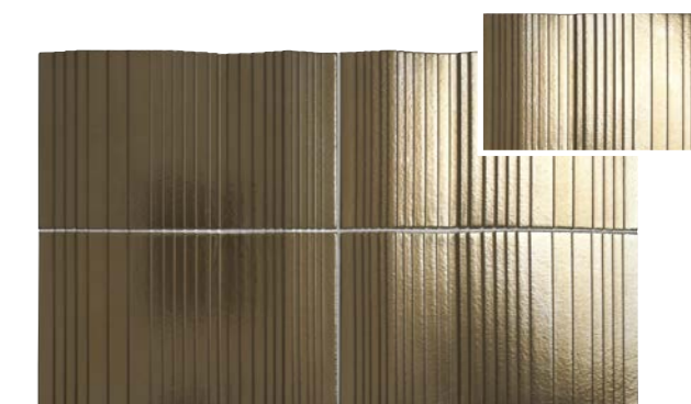
FIGURES ESCALE OR 15 x 25 (G 66) 6" x 10"