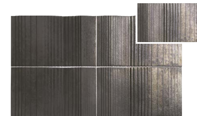
FIGURES ESCALE ARGENT 15 x 25 (G 66) 6" x 10"