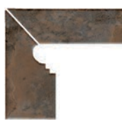
ZANQUÍN FIORENTINO CORTE ET-1501132 Drcho. ET-1511132 Izdo. 288 x 270 x 86