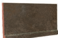
TABICA ET-5191132 310 x 150 x 28