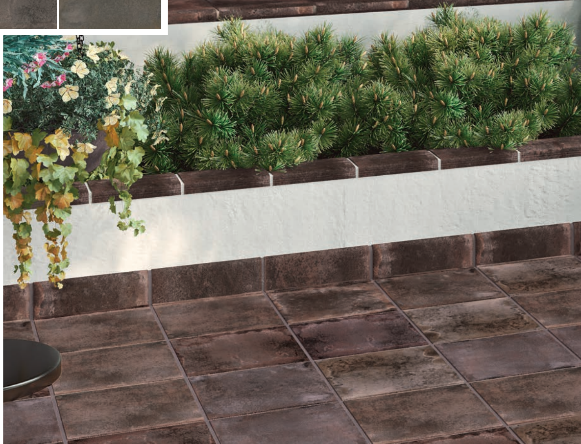
ETNA. BASE 310 x 310. PELDAÑO FIORENTINO, ESQUINA FIORENTINA. MOLDURA RECTA II Y RODAPIÉ.