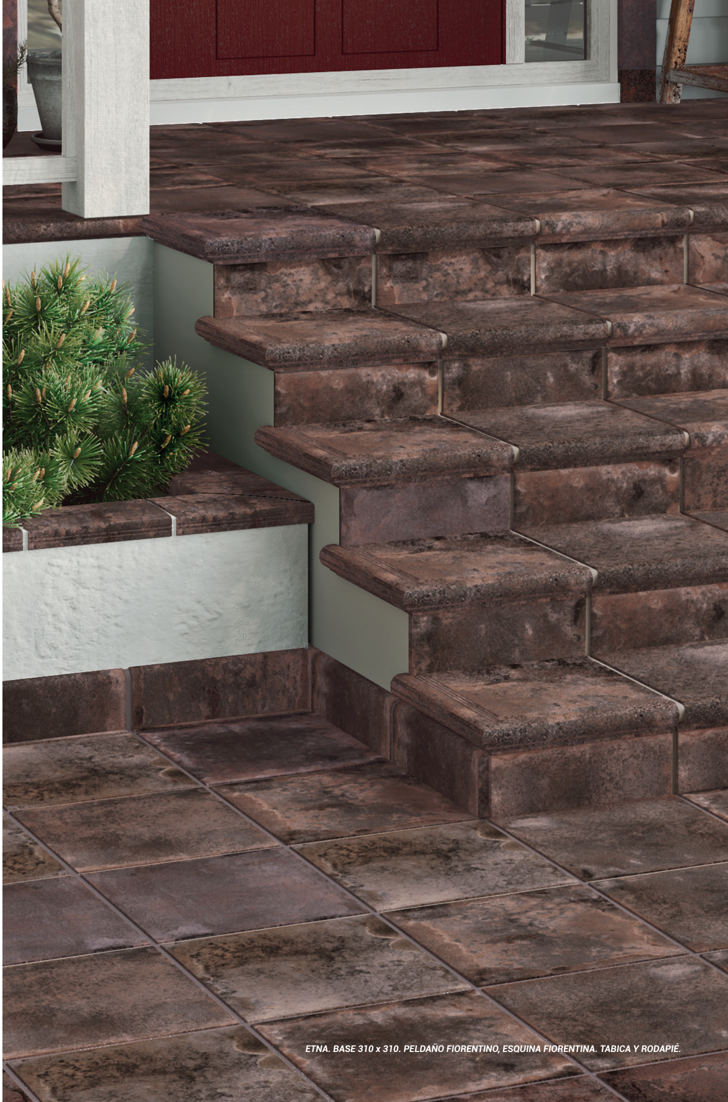
ETNA. BASE 310 x 310. PELDAÑO FIORENTINO, ESQUINA FIORENTINA. TABICA Y RODAPIÉ.