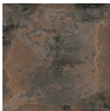
BASE ET-0041131 310 x 310 x 14