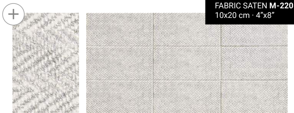
FABRIC SATEN M-220 10x20 cm · 4"x8"