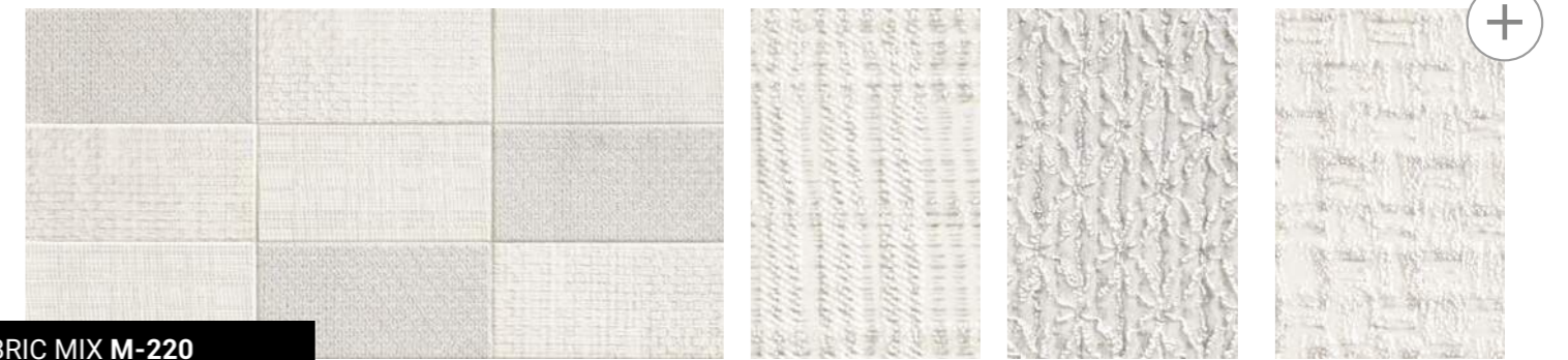
FABRIC MIX M-220 10x20 cm · 4"x8"