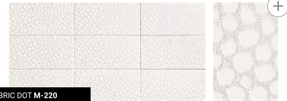
FABRIC DOT M-220 10x20 cm · 4"x8"