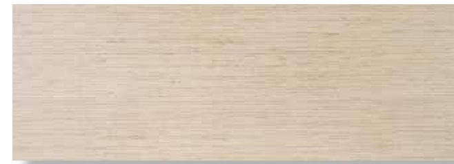
YAKARTA 31,6x90x0,93cm P3470507 / 100096157 G261 Butech recomienda junta / Butech recommends joint: Colorstuk Rapid n Beige B22502016 / 100004308