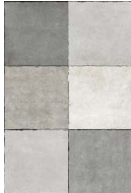
Composición con 6 piezas. Composition with 6 pieces.