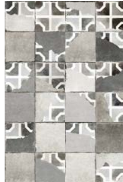
Composición con 6 piezas. Composition with 6 pieces.