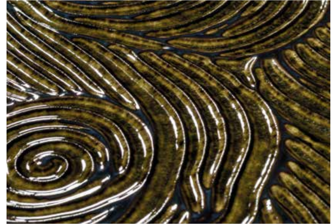
Detail : GLAM Green Rose

During installation, GLAM GREEN & SILVER ROSE tiles may present craquelure (glaze surface cracking). Moisturized tiles increases their volume, which tenses the glaze. When dry, the piece volume decreases and the crackles disappear.