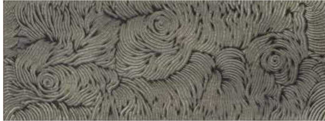
GLAM SILVER ROSE 45x120 (17.57"x46.97")