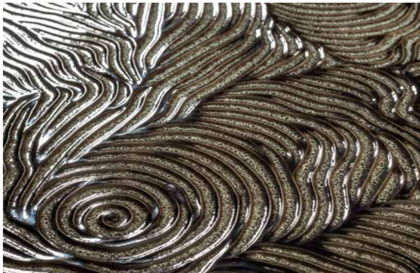
Detail : GLAM Silver Rose