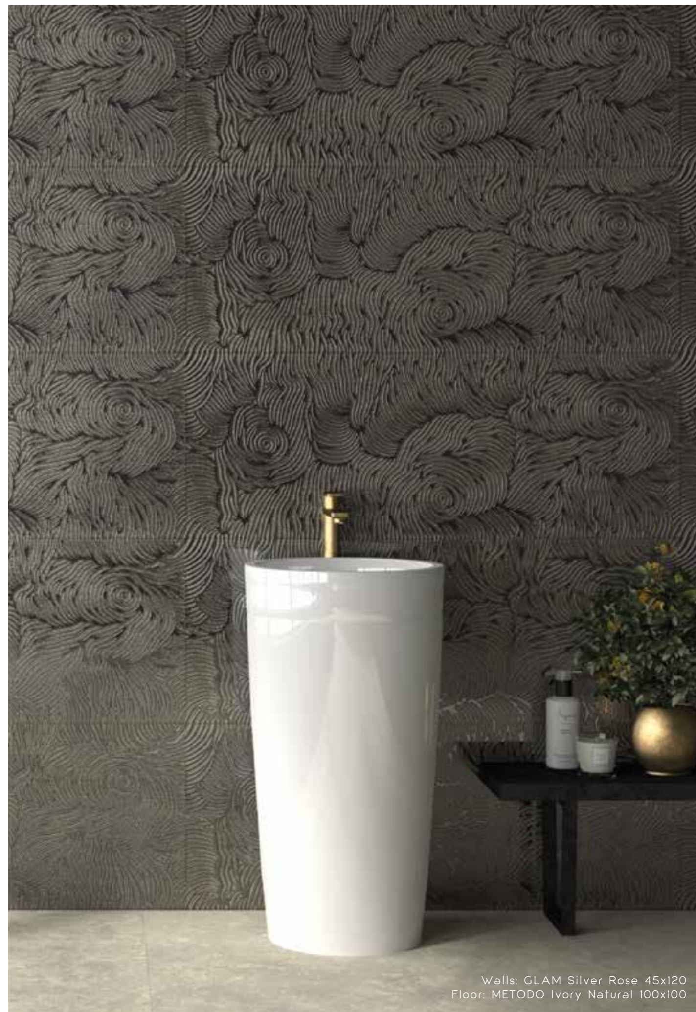
Walls: GLAM Silver Rose 45x120 Floor: METODO Ivory Natural 100x100

All sizes are rectified and without bevel edge finish. Todos los formatos son rectificadas y no biselados. Tiles with random shade and aspect variation. Producto con alta variación cromática y destonificación en composiciones.