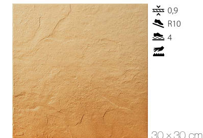
Gobi płytka uniwersalna rustykalna / универсальная рустикальная плітка / универсальна тільована плітка 5903263445456 30 × 30 cm