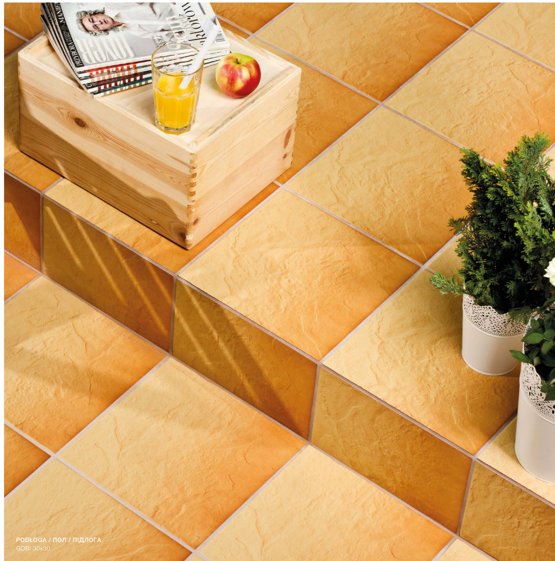
PODŁOGA / ПОЛ / ПІДЛОГА GOBI 30x30