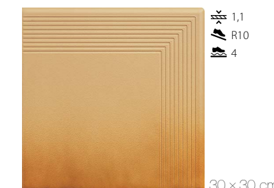
5903263445845 30 × 30 cm Gobi stopnica narożna / ступень угловая / сходишка кутава