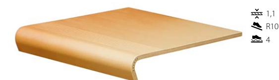
Gobi stopnica V-shape / ступень V-shape / сходишка V-shape 5901779370576 30 × 32/5 cm