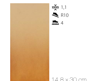
5903263446583 14,8 × 30 cm