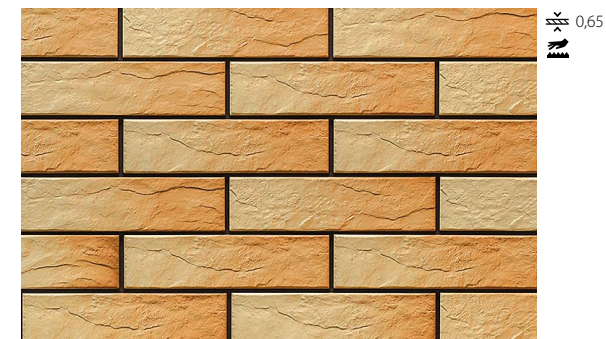
Gobi płytka elewacyjna rustykalna / фасадная рустикальная плітка / рустикальная фасадна тільована плітка 5903263449768 6,5 × 24,5 cm