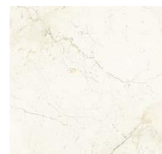
400243/IMX-40SR MARFIL SAT. RETT 600x600x10,5