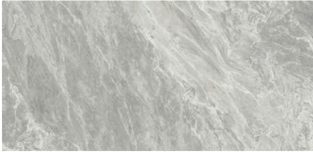
393537/IMX-12LR BARDIGLIO LEVIGATO RETT 600x1200x10,5