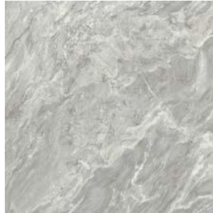
393541/IMX-10SR BARDIGLIO SATIN RETT 600x600x10,5