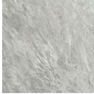
393538/IMX-10LR BARDIGLIO LEVIGATO RETT 600x600x10,5