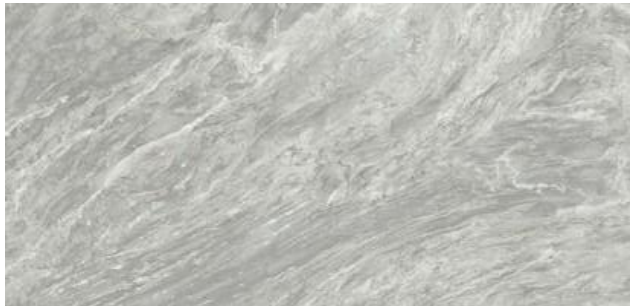
393532/IMX-12SR BARDIGLIO SATIN RETT 600x1200x10,5