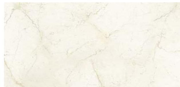
400240/IMX-42SR MARFIL SAT. RETT 600x1200x10,5