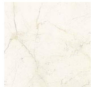
393544/IMX-40LR MARFIL LEVIGATO RETT 600x600x10,5