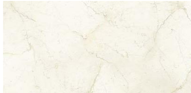
390718/IMX-42LR MARFIL LAP. RETT 600x1200x10,5