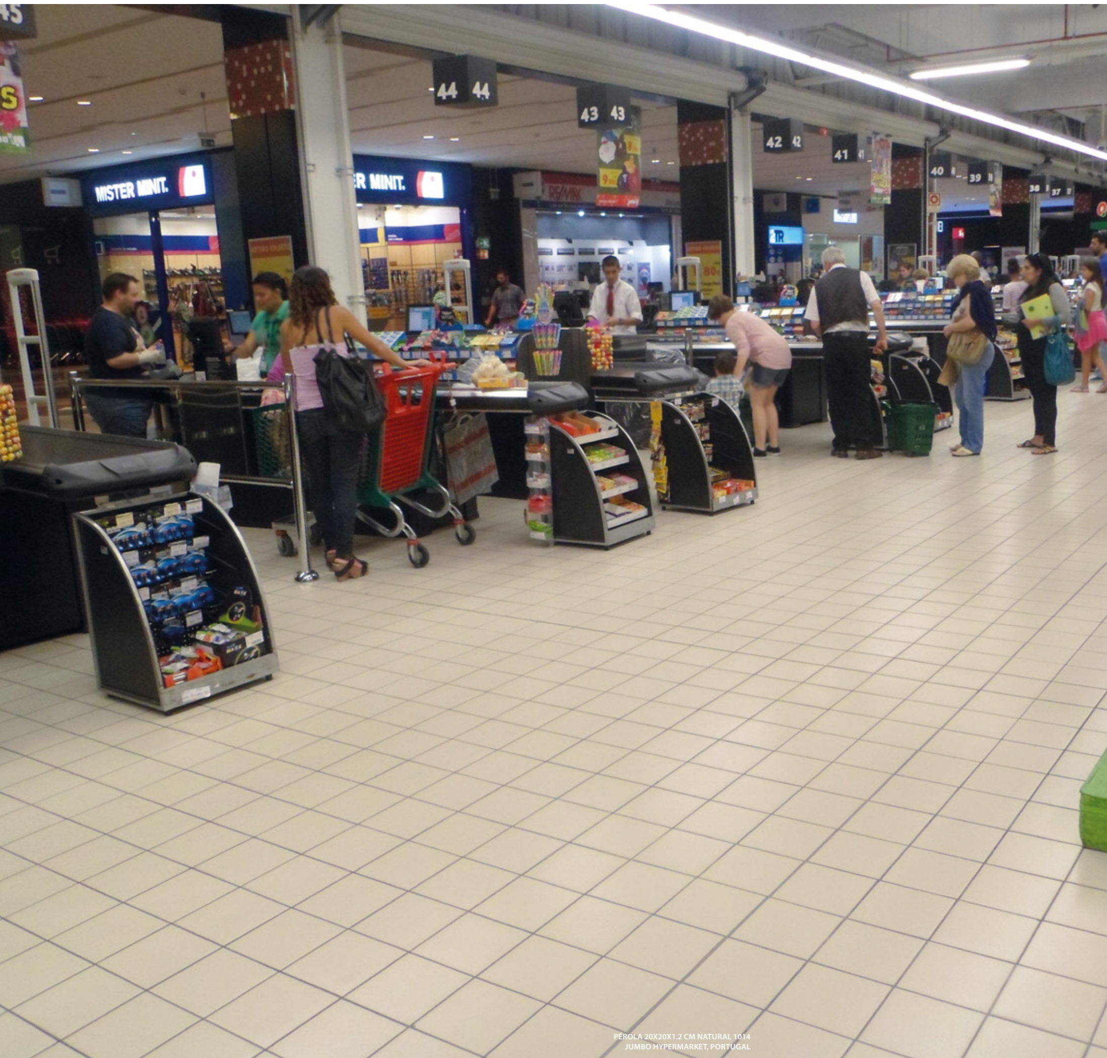
PÉROLA 20X20X1.2 CM NATURAL 1014 JUMBO HYPERMARKET, PORTUGAL