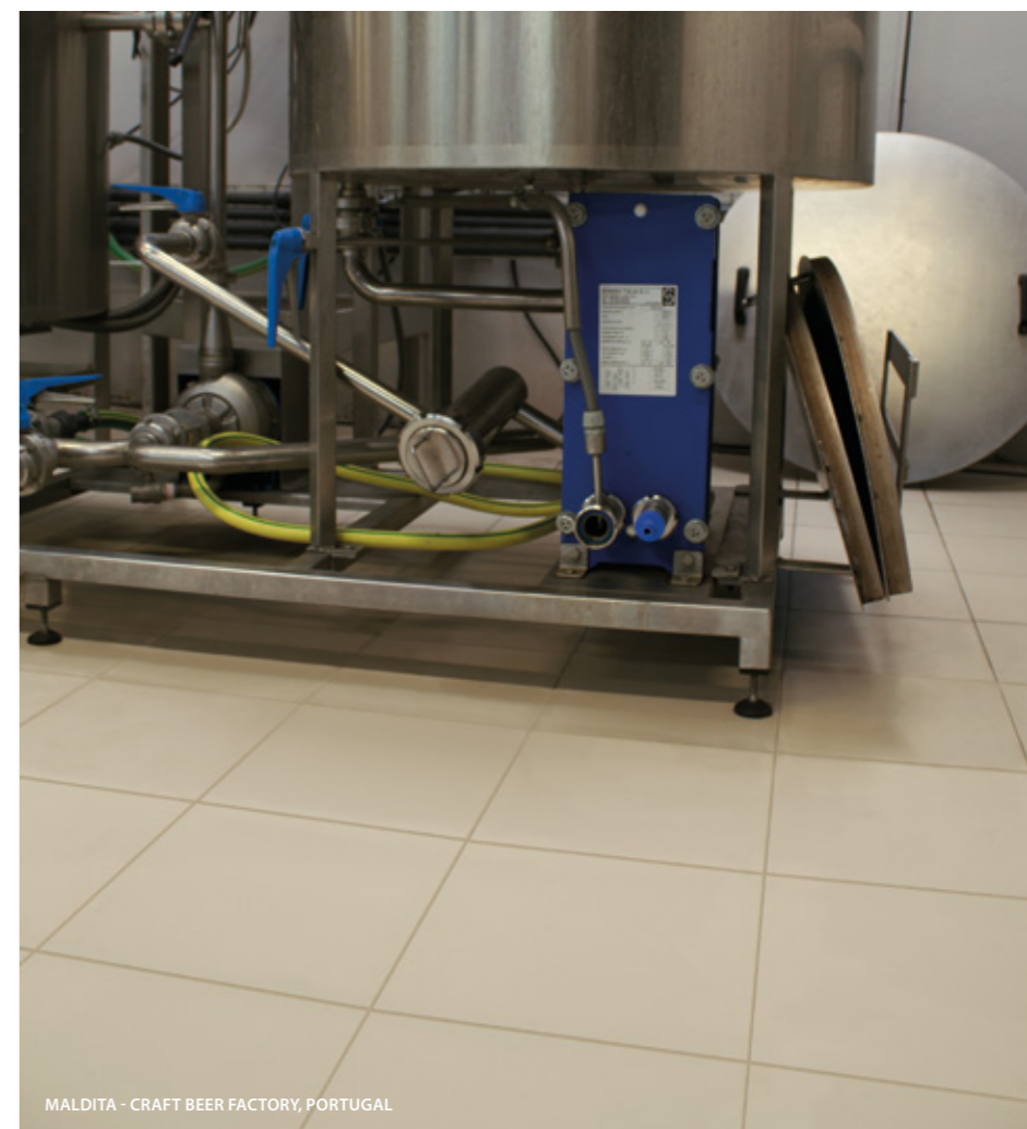
MALDITA - CRAFT BEER FACTORY, PORTUGAL