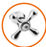
METALOWE POKRĘTŁA METAL KNOBS МЕТАЛЛИЧЕСКИЕ РУКОЯТКИ