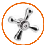
METALOWE POKRĘTŁA METAL KNOBS МЕТАЛЛИЧЕСКИЕ РУКОЯТКИ