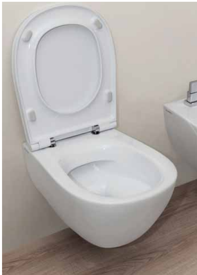
IO 2.0 goclean® art. IO118G - 55 x 38 x h 32 cm

goclean® ist ein von Flaminia entwickeltes System für die schnelle und einfache WC-Reinigung. Das randlose Design und ein neues Spülsystem mit Durchfluss-Steuerung gewährleisten im Vergleich zu traditionellen Systemen mehr Hygiene und eine höhere Benutzerfreundlichkeit, Eigenschaften, die für Sanitäranlagen sowohl im häuslichen als auch im öffentlichen Bereich von großer Bedeutung sind.