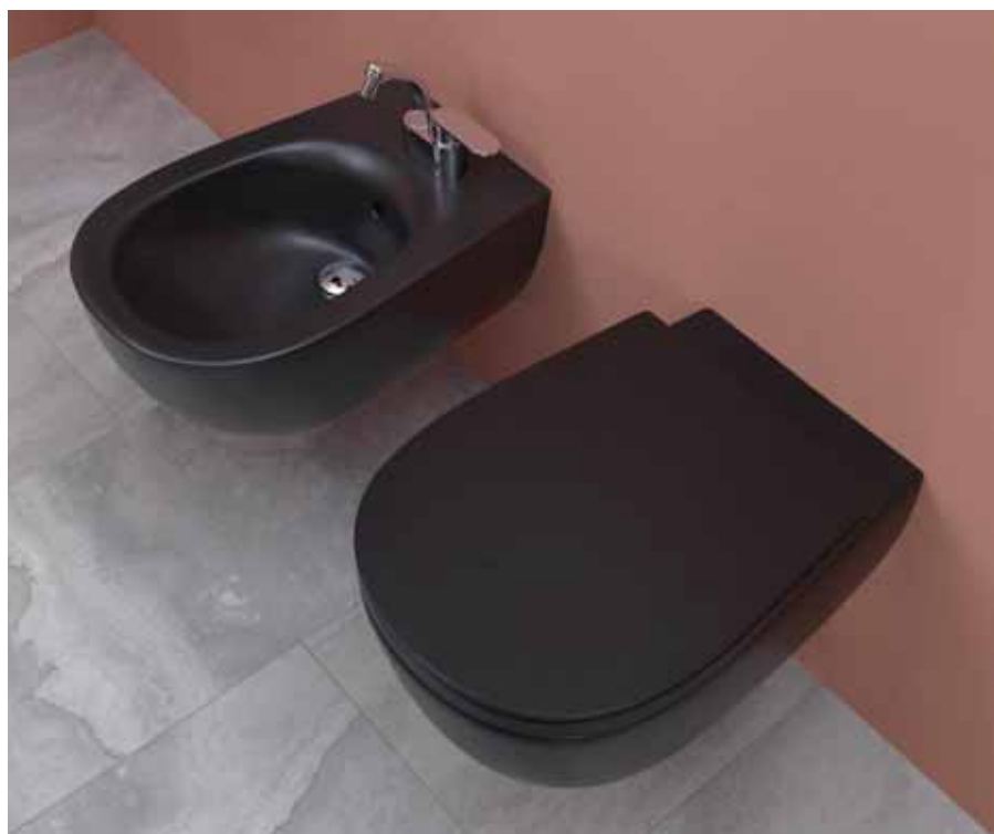
IO 2.0 _ Carbone art. IO118G-IOCW07 / IO218 55 x 38 x h 32 cm

Design ALEXANDER DURINGER - STEFANO ROSINI , 2016