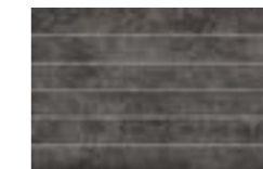
CAU4 ML-GALA BLACK 25X38 (4)