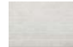
CAU1 ML-GALA ICE 25X38 (4)