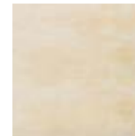
CAU7 GALA BEIGE-S 33X33