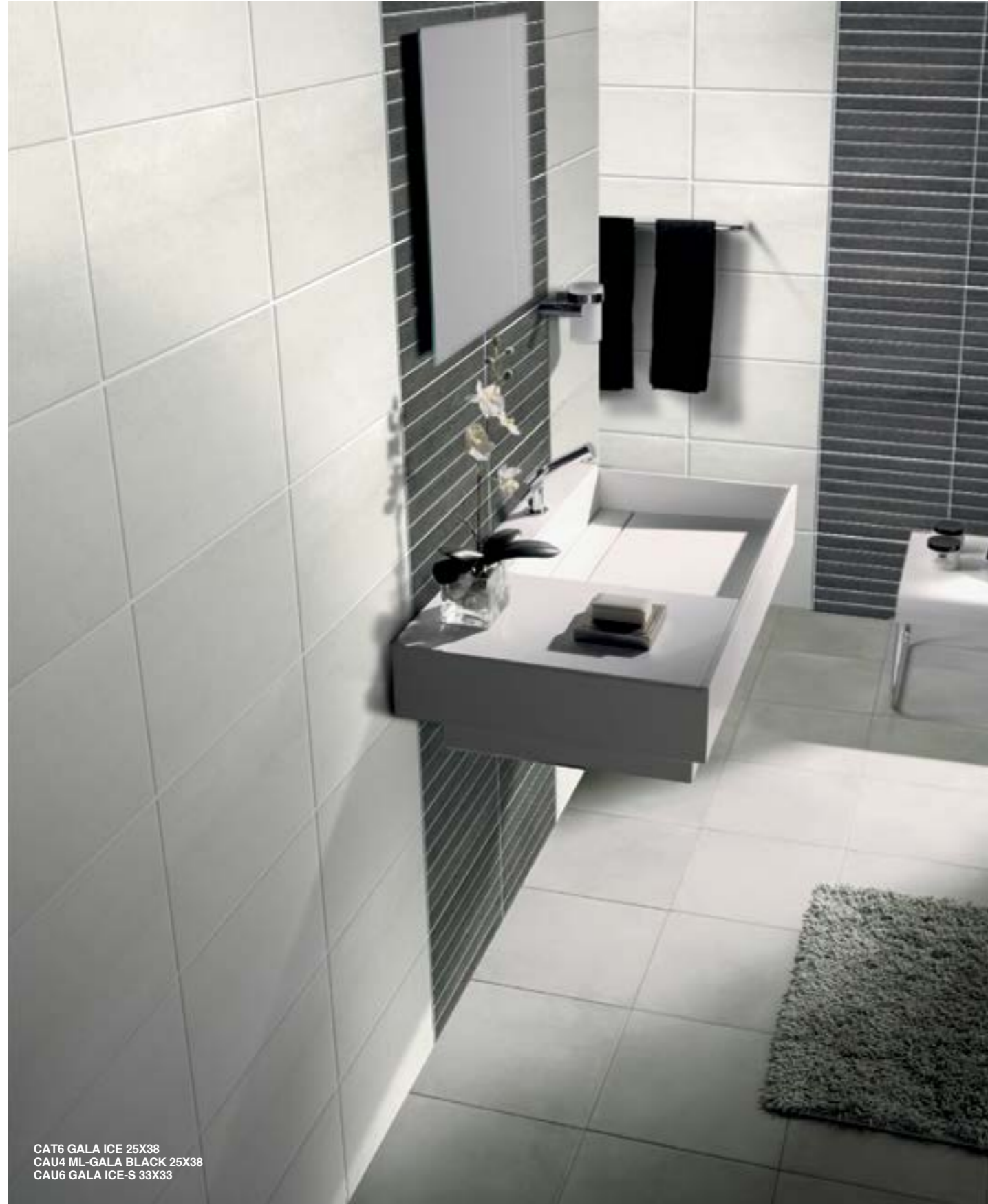
CAT6 GALA ICE 25X38 CAU4 ML-GALA BLACK 25X38 CAU6 GALA ICE-S 33X33

RIVESTIMENTO IN PASTA BIANCA / WHITE BODY WALL TILE / CARREAUX DE MUR EN PÂTE BLANCHE WEISSSCHERBIGE WANDFLIESEN / REVESTIMIENTOS DE PASTA BLANCA / ОБЛИЦОВОЧНАЯ ПЛИТКА БЕЛОЙ ПАСТЫ