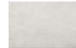
CAT6 GALA ICE 25X38