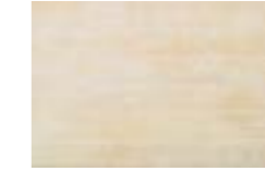
CAU2 ML-GALA BEIGE 25X38 (4)