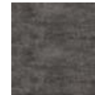
CAU9 GALA BLACK-S 33X33