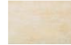
CAT7 GALA BEIGE 25X38

Conforme/According to/Conforme Gemäß/Conforme/Соответствует UNI EN 14411 - L BIII