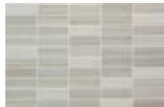
D166 MR-PLATEA GRIS 25X38