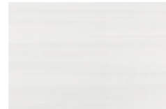
D157 PLATEA BLANCO 25X38

Conforme/According to/Conforme Gemäß/Conforme/Соответствует UNI EN 14411 - L BIII