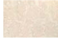
D249 D-PLATEA BEIGE 25X38