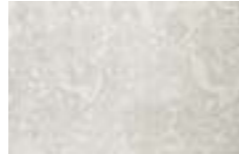
D250 D-PLATEA GRIS 25X38