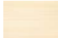
D159 PLATEA BEIGE 25X38