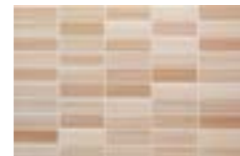
D165 MR-PLATEA BEIGE 25X38