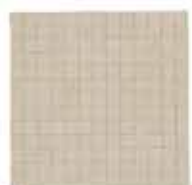
PROJECT PERLA MOSAICO * MMPR 30X30 (1)