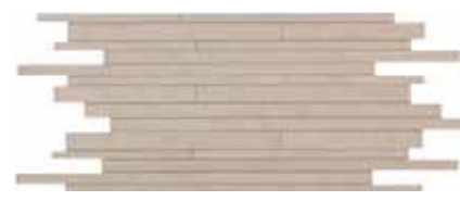
PROJECT PERLA MURETTO * MMPK 30X60 (2)

* Disponibile in tutti i colori / Available in all colours Disponibile dans toutes les couleurs / In allen Farben erhältlich Disponibile en todos los colores / Имеется всех цветов