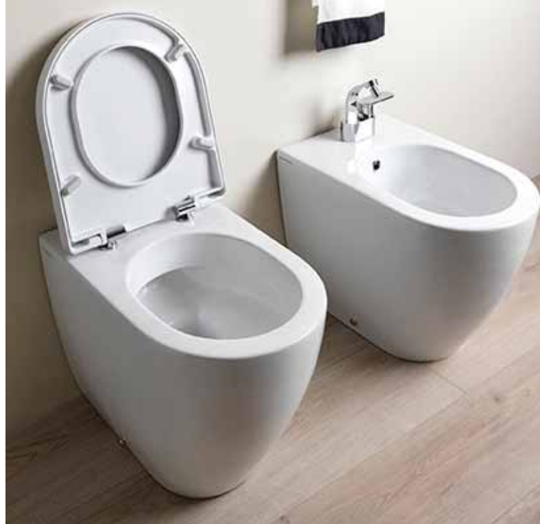
Link goclean® | Plus system art. LK117G - 56 x 36 x h 42 cm

Plus is a drainage system created for back to wall WCs, purposely designed to be easily adapted to existing drainage installations, it is an ideal solution for bathroom renovations. All Plus WCs are goclean® , the system created by Flaminia to make toilet cleaning simple and rapid.