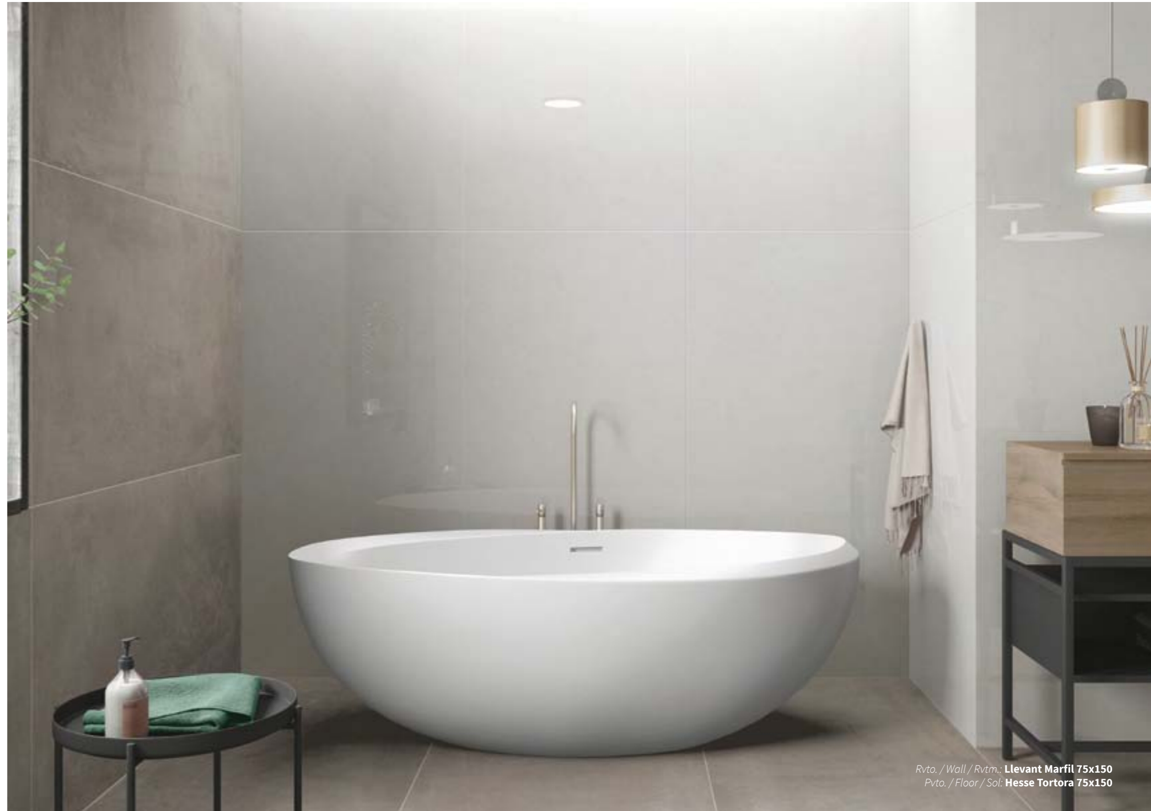
Rvto. / Wall / Rvrm.: Llevant Marfil 75x150 Pvto. / Floor / Sol: Hesse Tortora 75x150