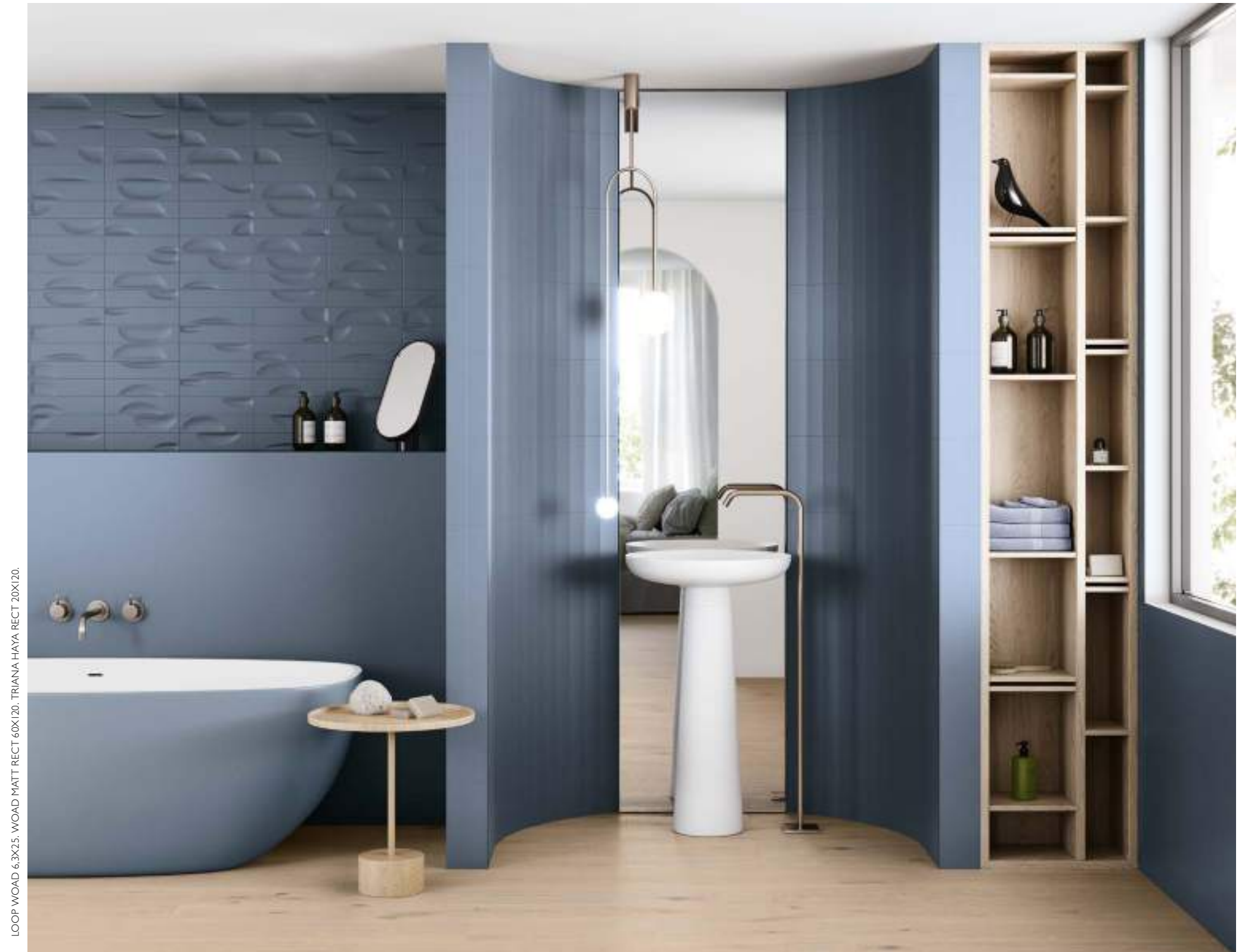
LOOP WOAD 6,3X25. WOAD MATT RECT 60X120. TRIANA HAYA RECT 20X120.

For more technical information, specifications and images, visit our website. The packing of our items is subject to variations. To get the most accurate and updated information, we recommend to check the website. Para más información técnica, especificaciones e imágenes visite nuestra web. El embalaje de los artículos está sujeto a variaciones, para obtener el dato exacto y actual se recomienda consultar la web.