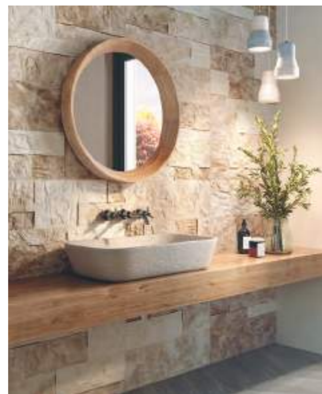
Marlstone Steel 21x63 Cm · 8"x25" > Marlstone Ivory 21x63 Cm · 8"x25" · Diamond Timber Olive Chevron 70x40 Cm · 27,5"x16" > Marlstone Nature 21x63 Cm · 8"x25" · Modular Borgogna Stone Beige