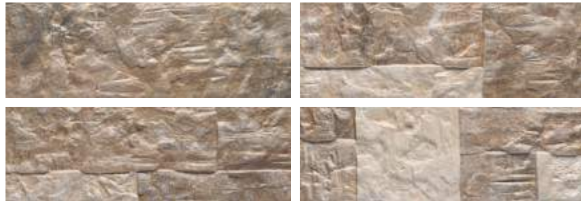
Marlstone Nature 21x63 Cm · 8"x25" · K-39