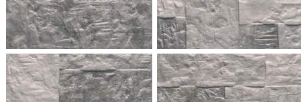
Marlstone Steel 21x63 Cm · 8"x25" · K-39