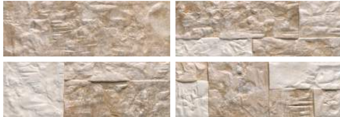
Marlstone Ivory 21x63 Cm · 8"x25" · K-39