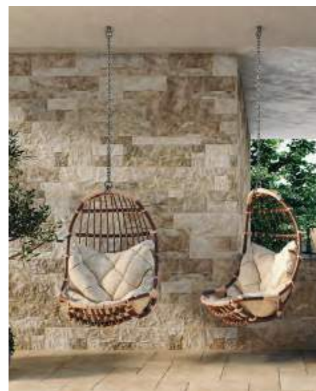
Marlstone Terra 21x63 Cm · 8"x25" > Marlstone Iron 21x63 Cm · 8"x25" > Marlstone Steel 21x63 Cm · 8"x25"