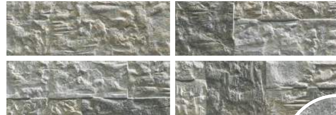
Marlstone Iron 21x63 Cm · 8"x25" · K-39