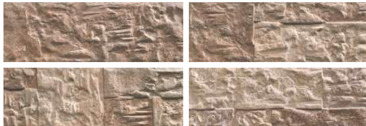
Marlstone Terra 21x63 Cm · 8"x25" · K-39