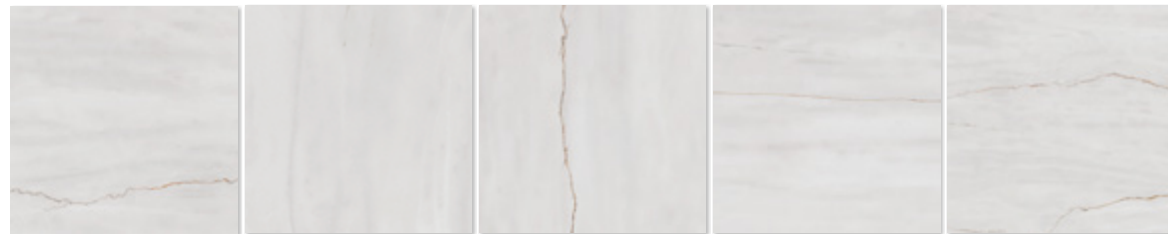
MASSA WHITE POLISHED

AVAILABLE FORMATS: / FORMATOS DISPONIBLES: