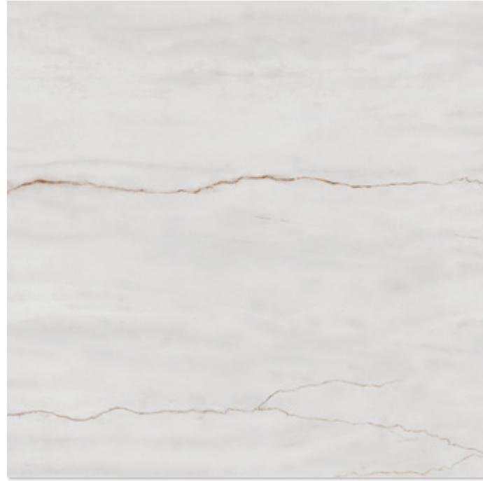
MASSA WHITE POLISHED