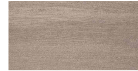
MATERIA MUSGO MATERIA MUSGO ANTIDESLIZANTE 30 x 60 cm. M 37