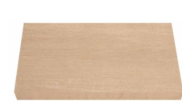
PELDAÑO TOP MATERIA MIEL / MUSGO / LEGNO / CENIZA 30 x 60 cm. P 60