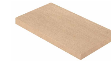
ÁNGULO TOP DERECHO MATERIA MIEL / MUSGO / LEGNO / CENIZA 30 x 60 cm. P 75