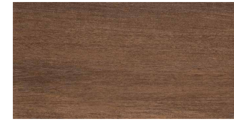
MATERIA LEGNO MATERIA LEGNO ANTIDESLIZANTE 30 x 60 cm. M 37