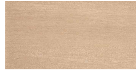
MATERIA MIEL 30 x 60 cm. M 37