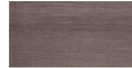
MATERIA CENIZA MATERIA CENIZA ANTIDESLIZANTE 30 x 60 cm. M 37