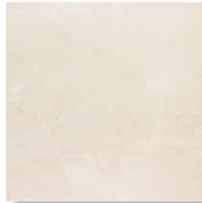
MÁRMOL NILO MARFIL 59,6x59,6x1,1cm P1856891 / 100137753 G347 Butech recomienda junta / Butech recommends joint: Colorstuk Rapid n Gris B22502013 / 100004305