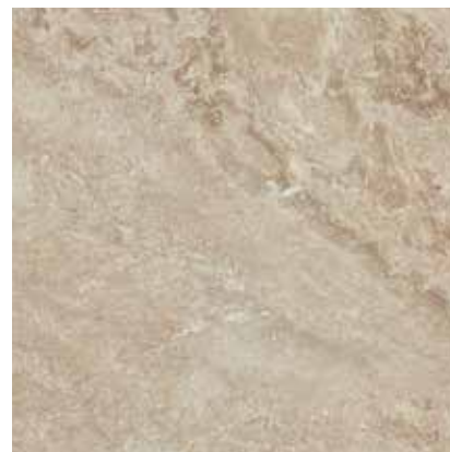
VERONA ARENA 43,5x43,5cm P1459100 / 100145880 G331 Butech recomienda junta / Butech recommends joint: Colorstuk Rapid n Tabaco B22502011 / 100004304