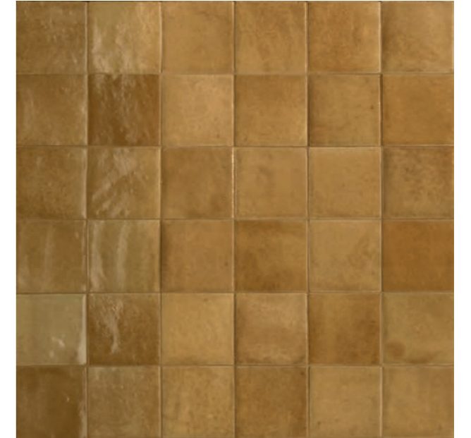
R8G1 Mélange Kaki 10x10 - 3 15/16 "x3 15/16 "