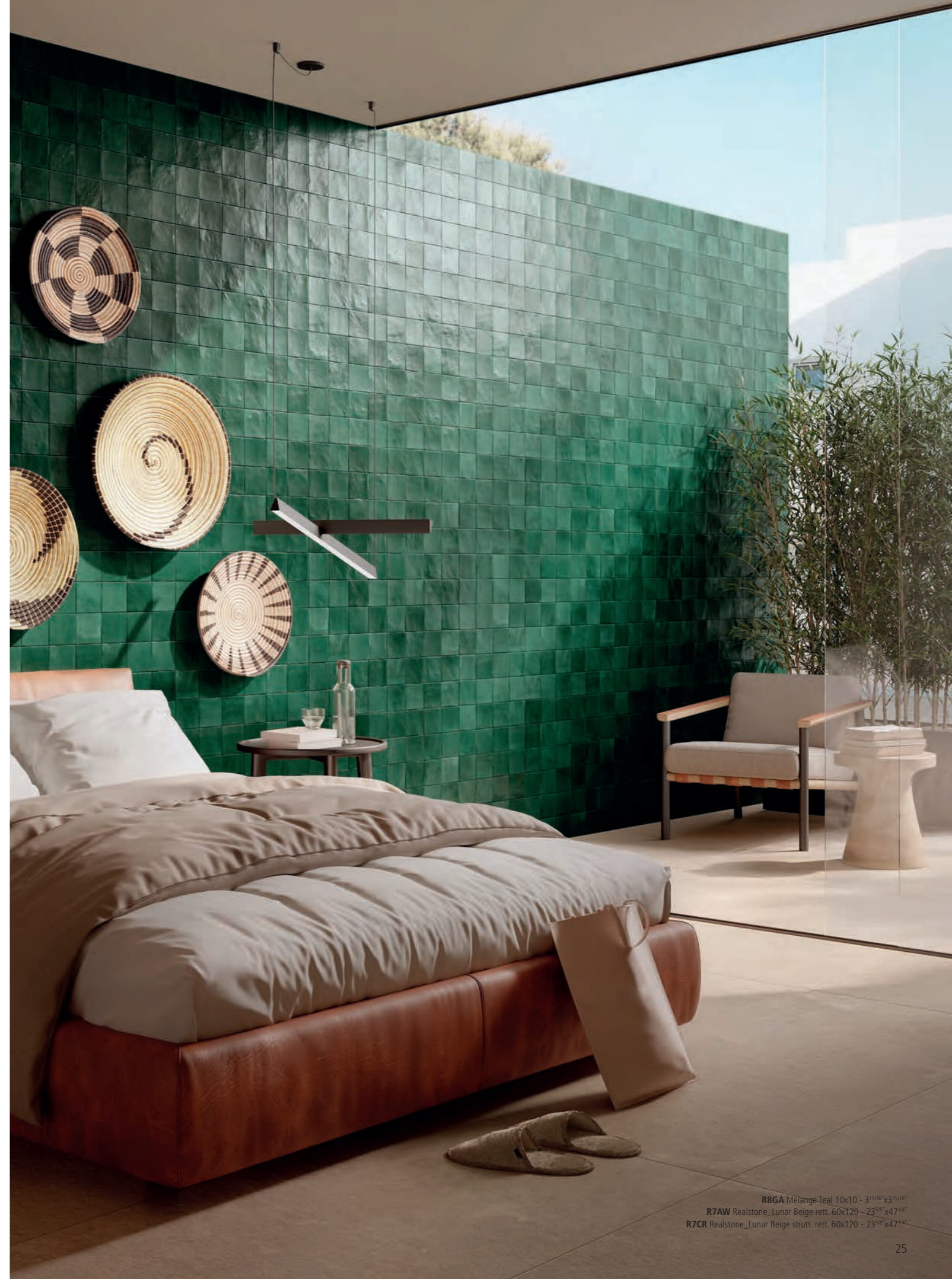
R8GA Mélange Teal 10x10 - 3 15/16 "x3 15/16 " R7AW Realstone_Lunar Beige rett. 60x120 - 23 5/8 "x47 1/4 " R7CR Realstone_Lunar Beige strutt. rett. 60x120 - 23 5/8 "x47 1/4 "