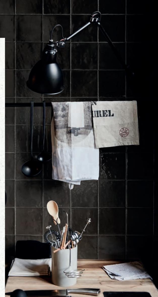
R8GF Mélange Nero 10x10 - 3'15/16" x 3'15/16"

Коллекция Mélange вдохновлена материалом с богатой историей и традицией. Этот удачный союз традиций и дизайна развивает и переосмысливает тему цвета, раскрывая неожиданный современный характер. Девять разных оттенков играют с правильными формами, блеском глазури на плитке, яркая цветовая насыщенность которой обусловлена почти бесконечными графическими элементами, предложенными для каждого из 9 цветов.