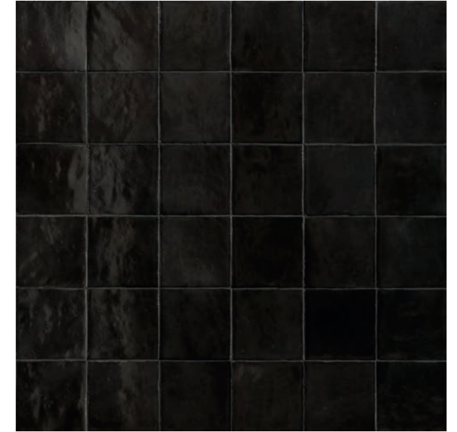
R8GF Mélange Nero 10x10 - 3 15/16 "x3 15/16 "