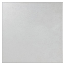
MILLA JET BONE