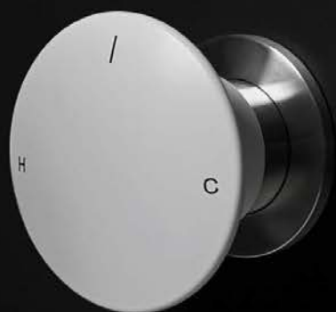
art. MAYDAY verniciato bianco / white lacquered