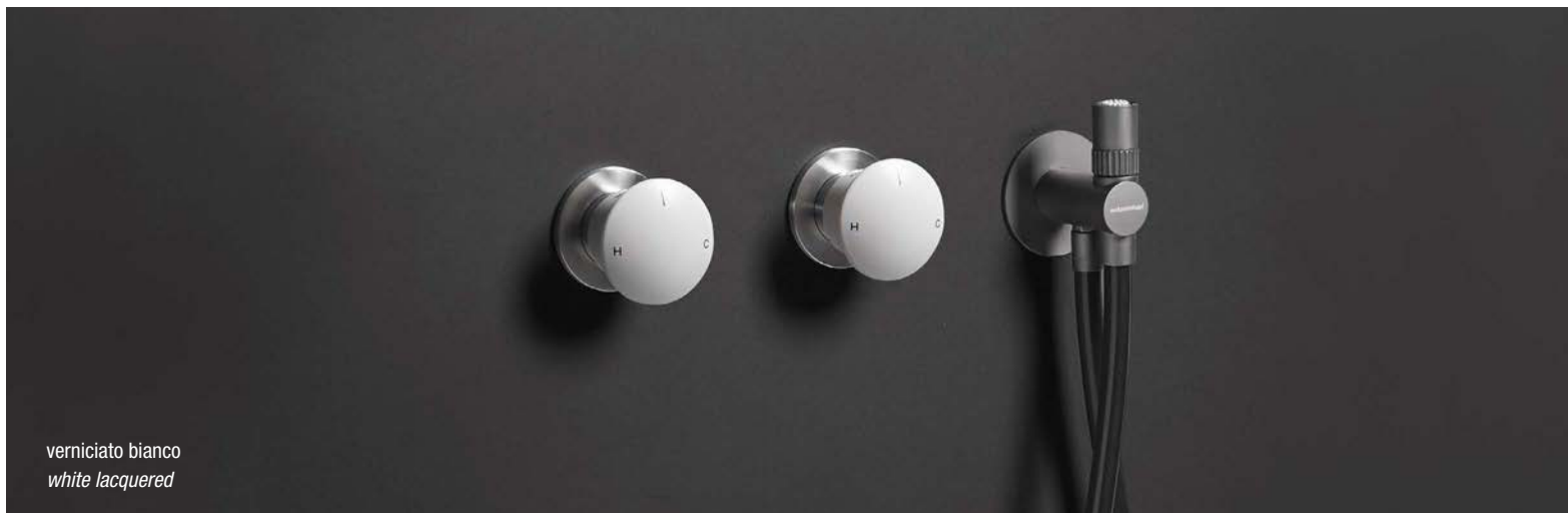
verniciato bianco white lacquered