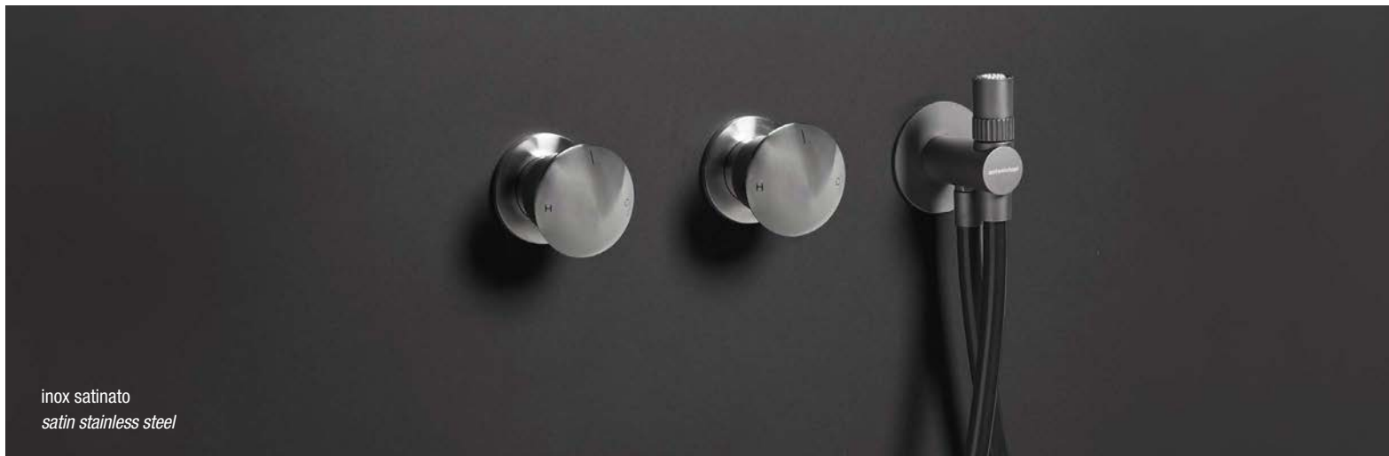
inox satinato satin stainless steel