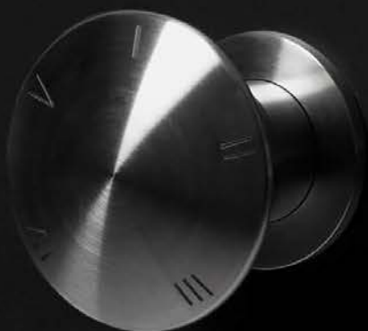
art. MAYDAYAYD inox satinato / satin stainless steel