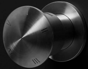
art. MINIMAYDAYAYD inox satinato / satin stainless steel