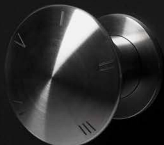
art. MAYDAYAYD inox satinato / satin stainless steel