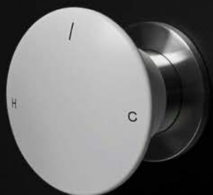
art. MAYDAY verniciato bianco / white lacquered