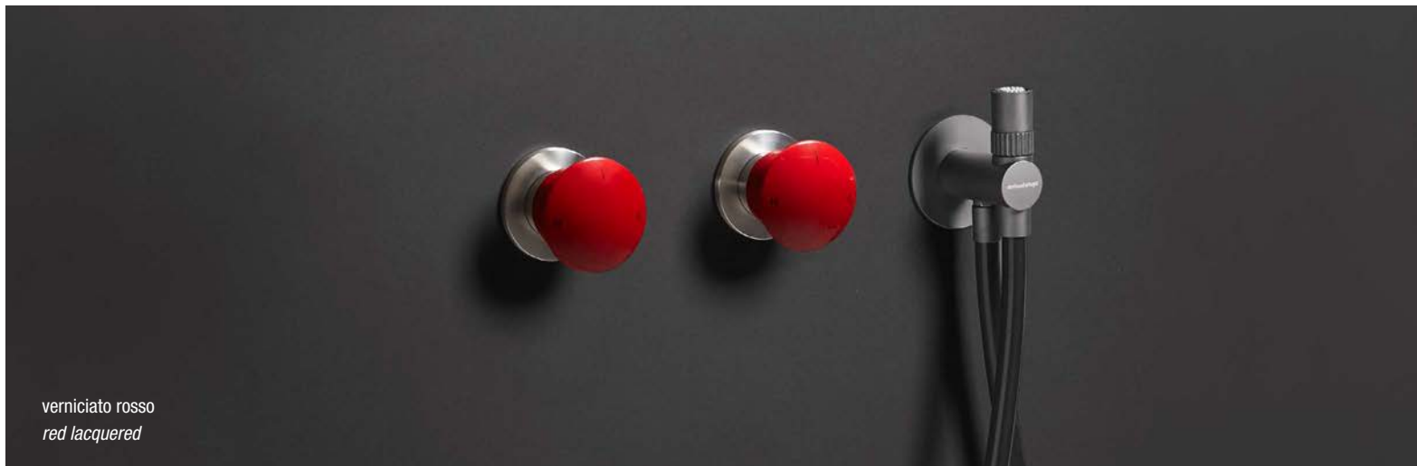
verniciato rosso red lacquered