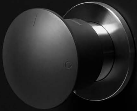
art. MINIMAYDAY grafite / graphite