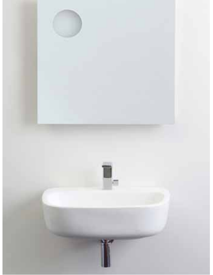
Monò 64 _ Latte art. MN64L - 64 x 48 x h 18,5 cm