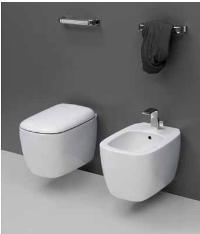
Monò art. MN118-MNCW03 / MN218 52 x 35 x h 32 cm