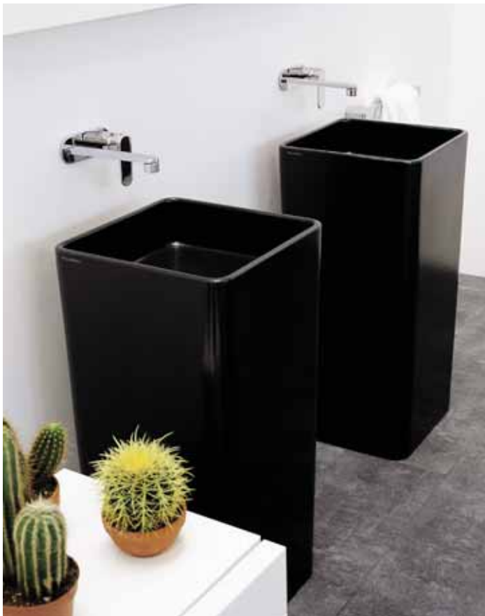
Monowash _ Nero art. MW40P - 40 x 40 x h 85 cm