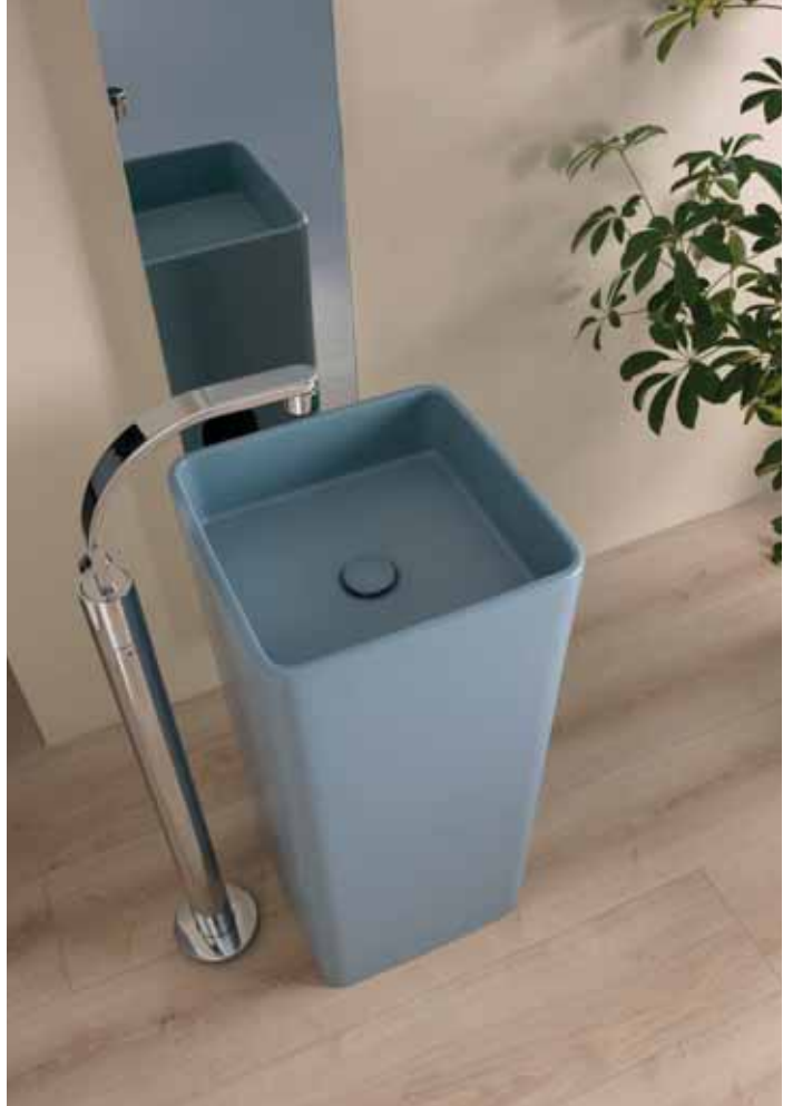
Monowash _ Nuvola art. MW40C - 40 x 40 x h 85 cm