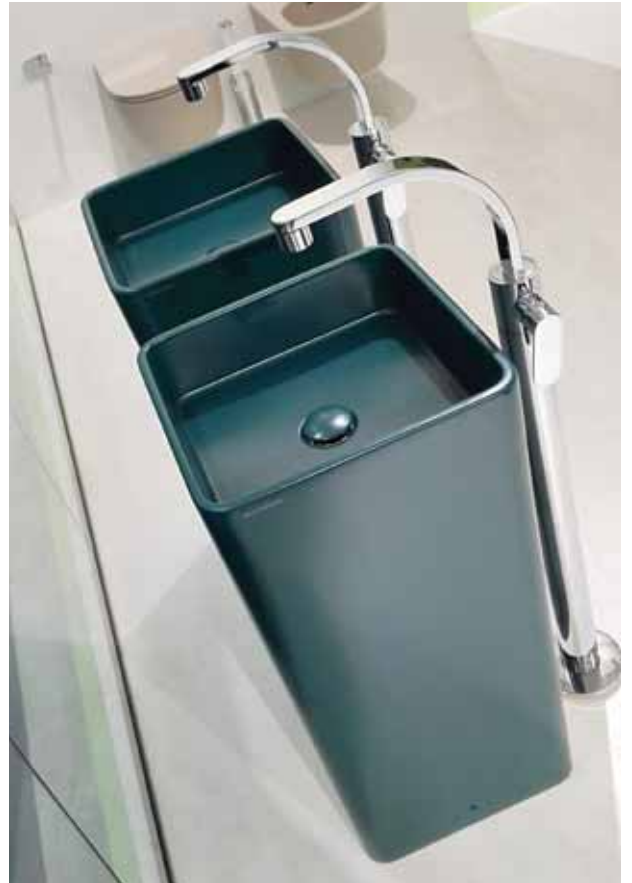
Monowash _ Petrolio art. MW40C - 40 x 40 x h 85 cm