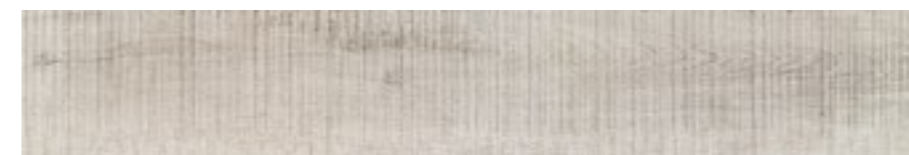
NAIF GRIS (6)