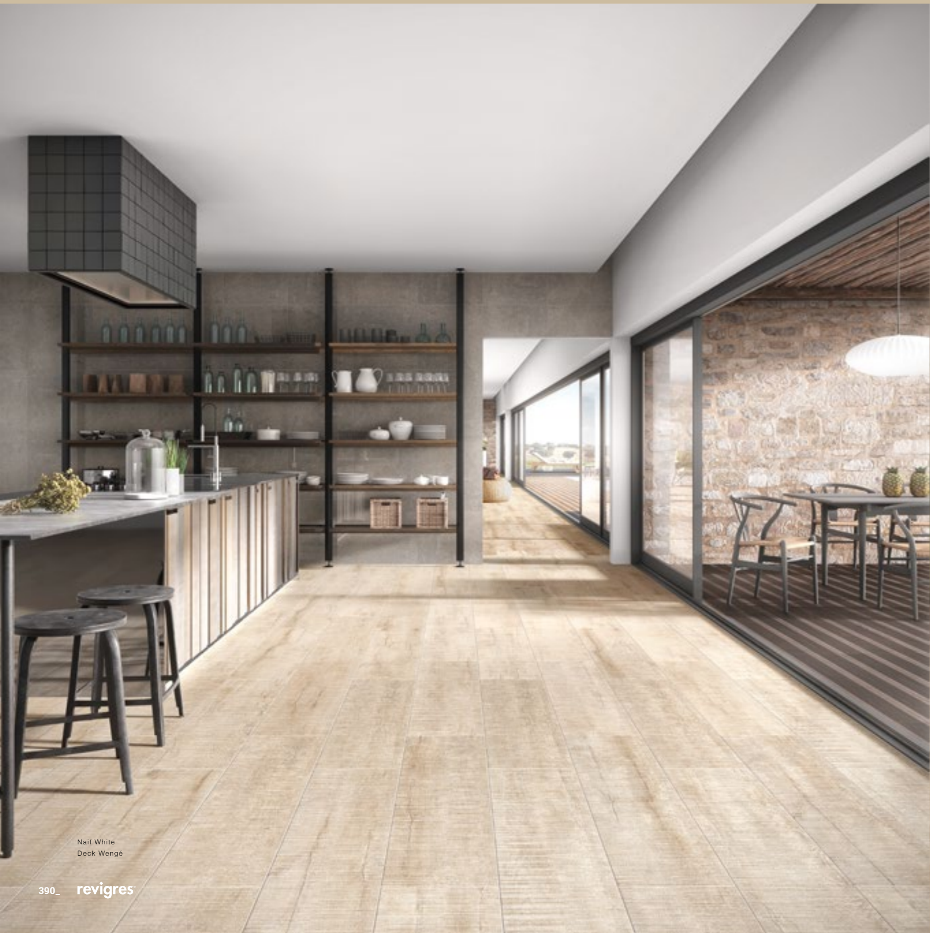
Naif White Deck Wengé