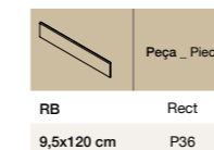
RB 9,5x120 cm 9,5x60 cm Rect P36 P16