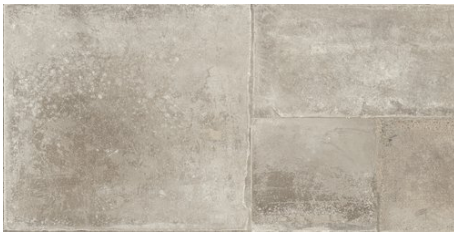
NAQUERA SAGE (20)