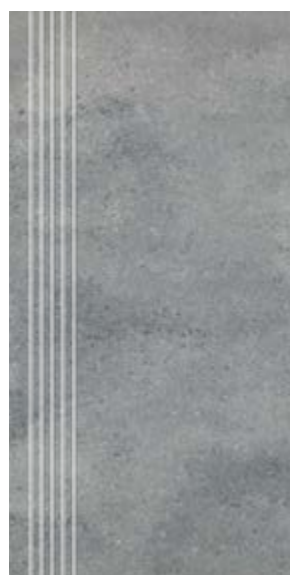
Stopnica NU 13 29,7x59,7 cm natura, poler