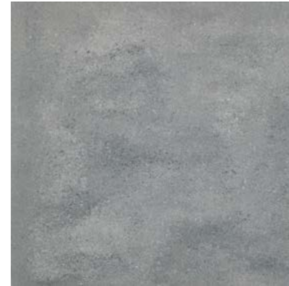
NU 13 59,7x59,7 cm natura R10 59,7x59,7 cm poler