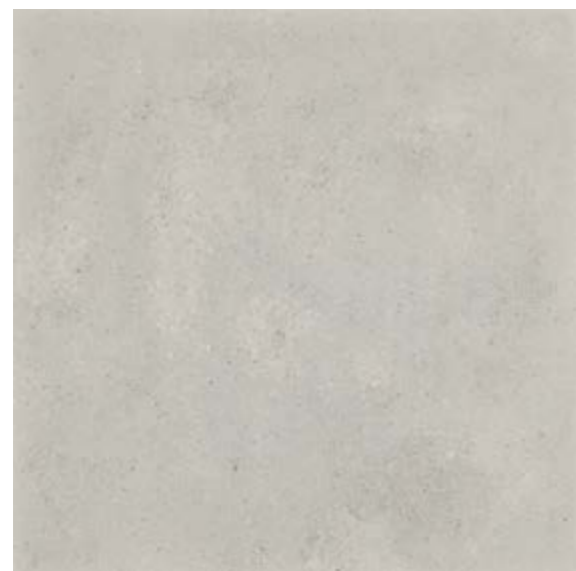
NU 12 59,7x59,7 cm natura R10 59,7x59,7 cm poler