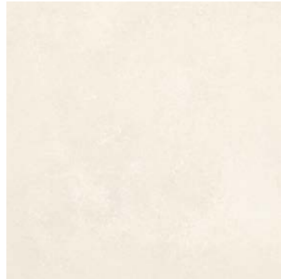
NU 01 59,7x59,7 cm natura R10 59,7x59,7 cm poler