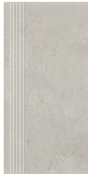
Stopnica NU 12 29,7x59,7 cm natura, poler