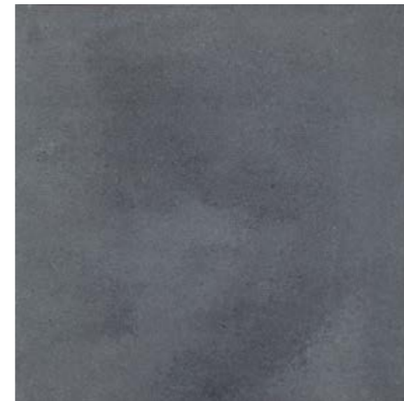
NU 14 59,7x59,7 cm natura R10 59,7x59,7 cm poler