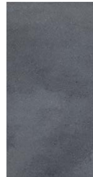
NU 14 29,7x59,7 cm natura R10 29,7x59,7 cm poler