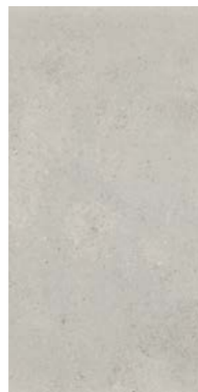
NU 12 29,7x59,7 cm natura R10 29,7x59,7 cm poler