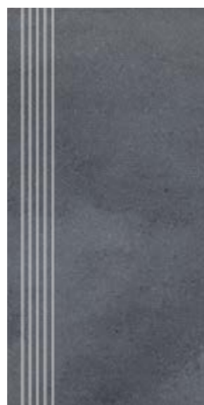
Stopnica NU 14 29,7x59,7 cm natura, poler