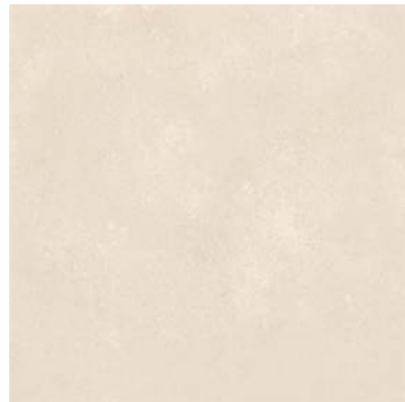
NU 02 59,7x59,7 cm natura R10 59,7x59,7 cm poler