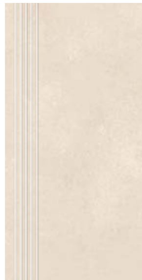
Stopnica NU 02 29,7x59,7 cm natura, poler