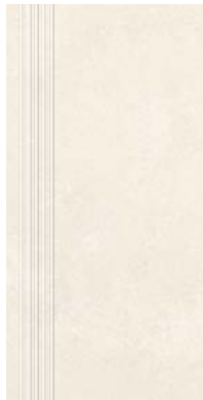
Stopnica NU 01 29,7x59,7 cm natura, poler

Stopnica / Stair tread tiles / Treppenstufen / Ступеньки Cokół / Skirting / Sockel / Плинтусы