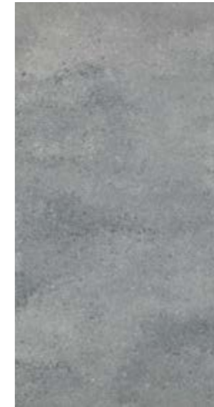
NU 13 29,7x59,7 cm natura R10 29,7x59,7 cm poler