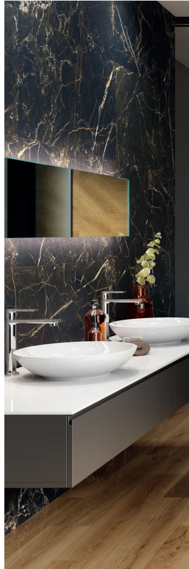
NIGHT LUX BLACK MATT RECT: 60X120, KOENI MIELE POLISHED 20X120, ZANKU MIELE MATT RECT 80X80.