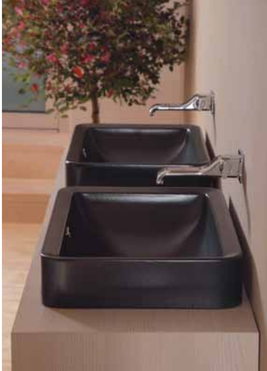
Nile 62 _ Carbone art. NL62INC - 62 x 40 x h 10 cm