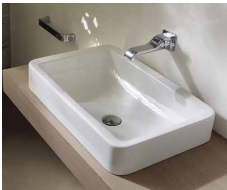
Nile 62 art. NL62A - 62 x 40 x h 10 cm