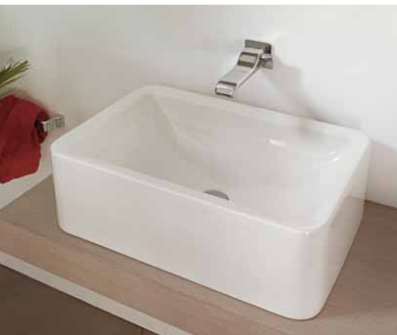
Nile 62 H20 art. NL62H20 - 62 x 40 x h 20 cm