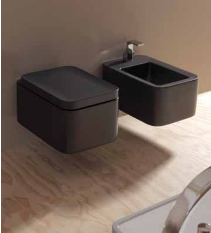
Nile goclean® _ Carbone art. NL118G - 56 x 36 x h 20 cm