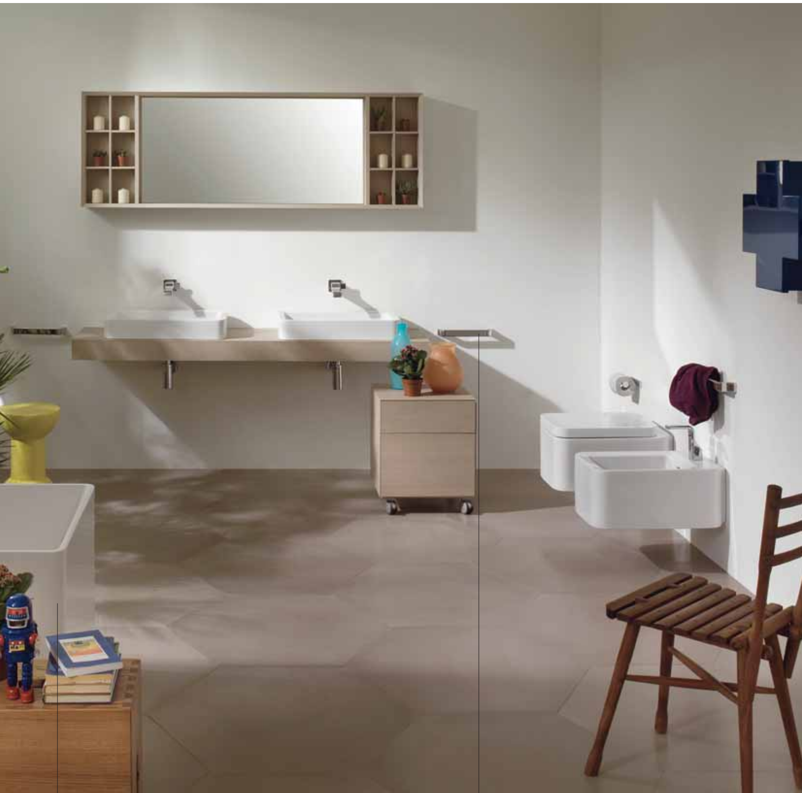
Wash p. 212