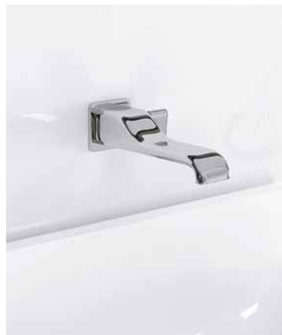
Nokè art. NK3230