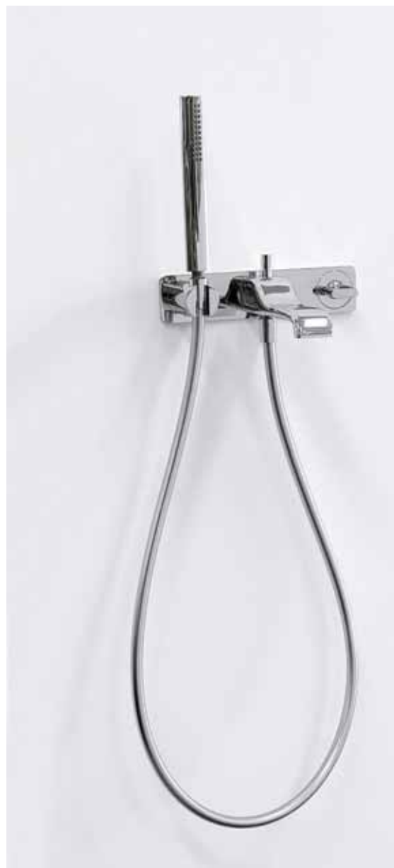
Nokè art. NK3290