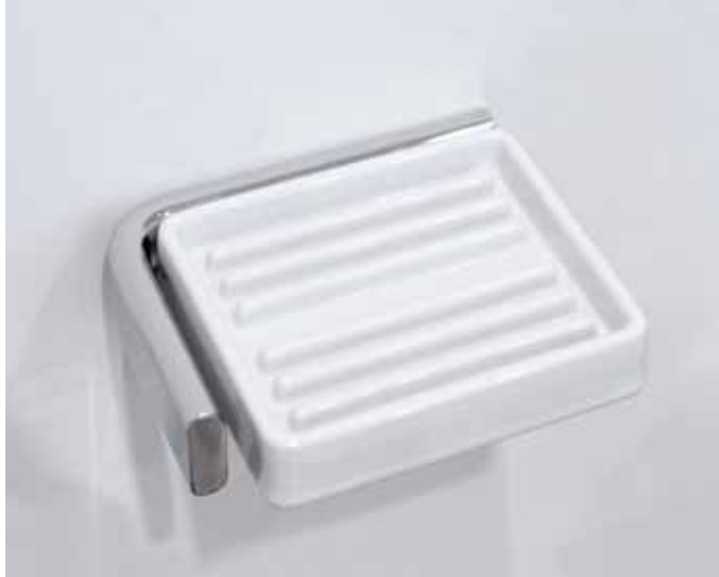
Nokè art. NKPSC