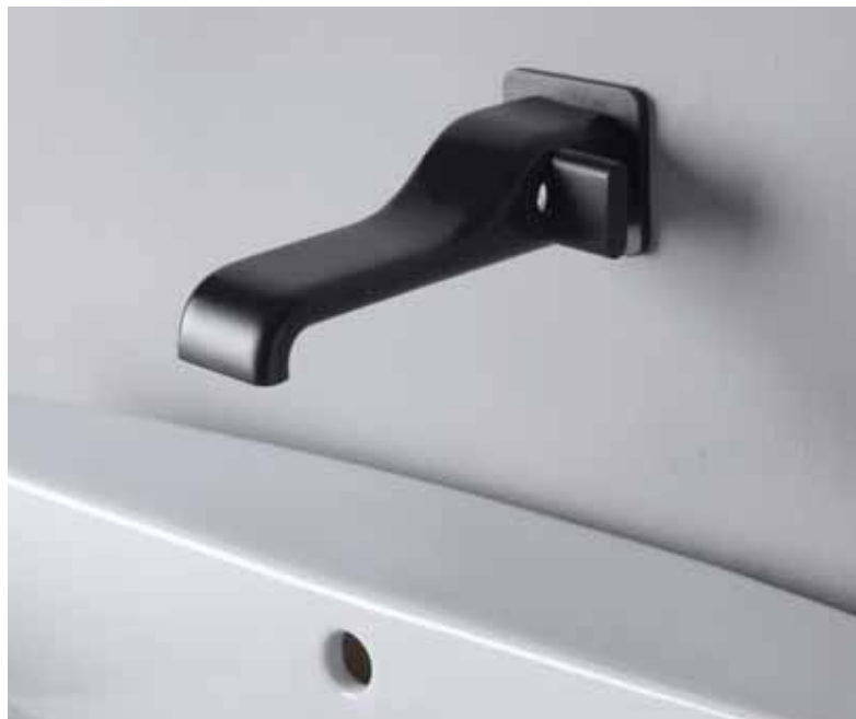
Nokè _ Nero mat art. NK3230