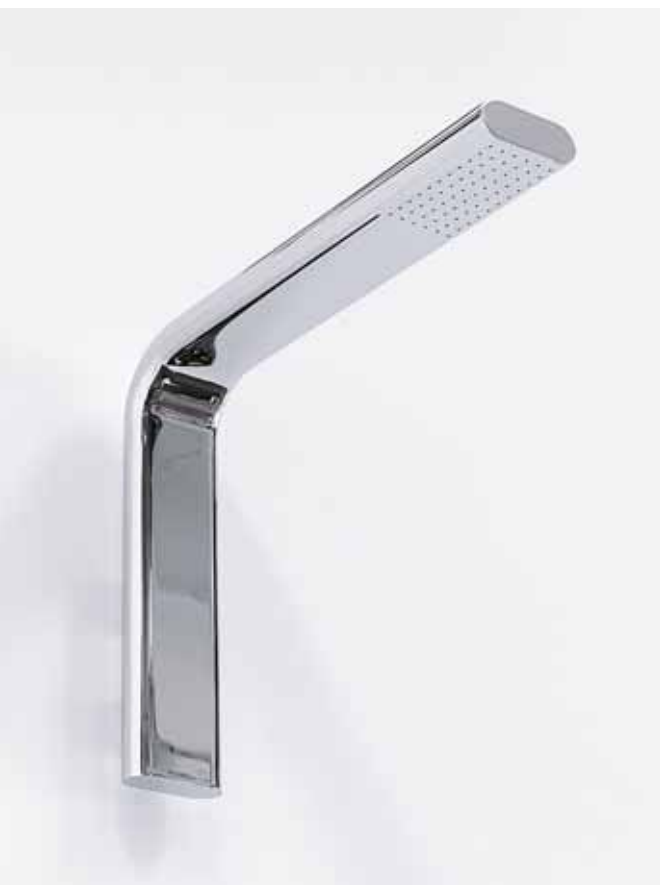
Nokè art. NK3270