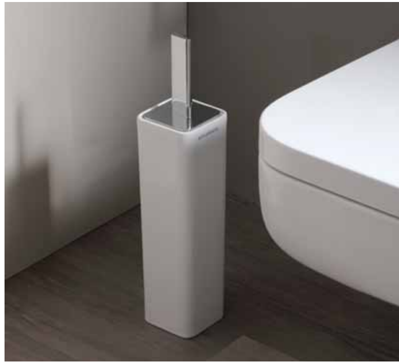
Nokè art. NKPFC