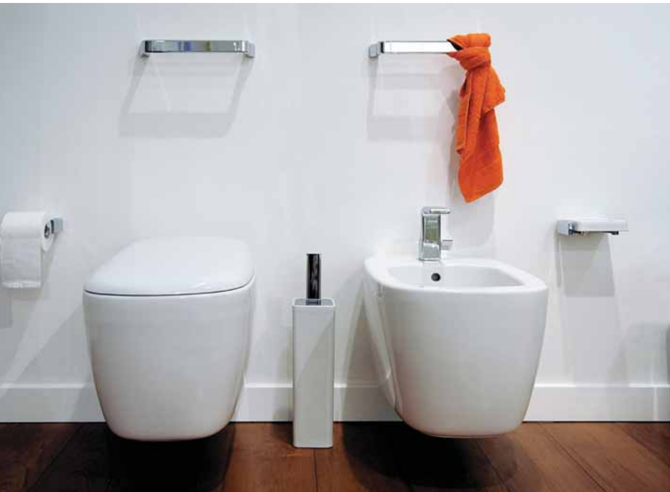
Nokè art. NK30