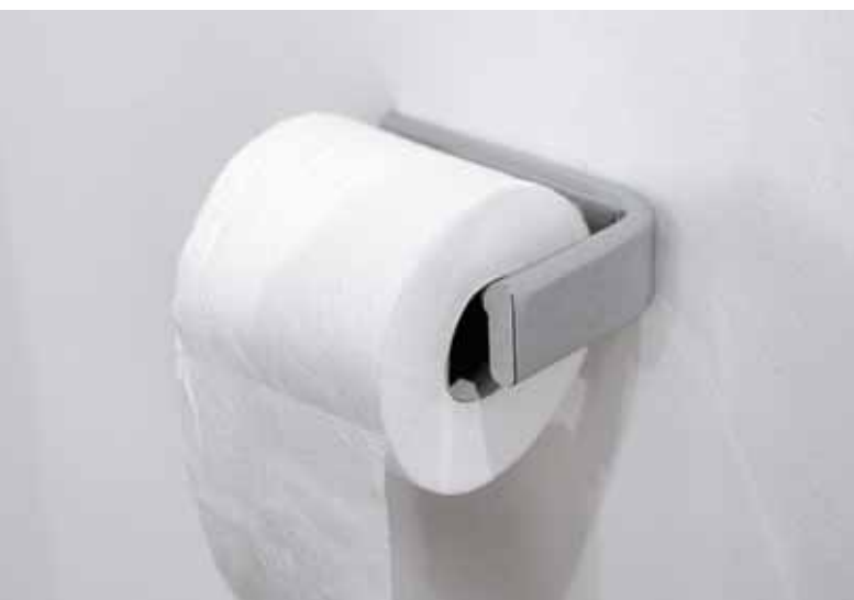
Nokè art. NKPR

Taps and accessories that, by tackling the theme of essentialness in an unconventional manner, espouse the identity of the sign and sobriety. A fluid line which, speaking of mixers, resolves the contrast between rigorous geometries with the oval section of the tap lever and sinuous volumes of the joint with a union outlining a definitely expressive silhouette. Using ceramic for some details of the soap dish and toilet brush holder makes for a precious counterpoint that is perfectly integrated into the texture of the chrome-plated surface.