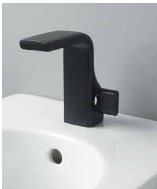
Nokè _ Nero mat art. NK3210