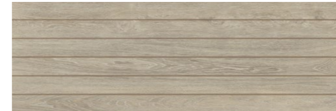
NORDIK LINES TAUPE 30x90 RECT [ 29,5x88,9x1,23 cm ] P95