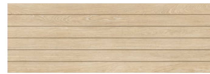
NORDIK LINES WHITE 30x90 RECT [ 29,5x88,9x1,23 cm ] P95