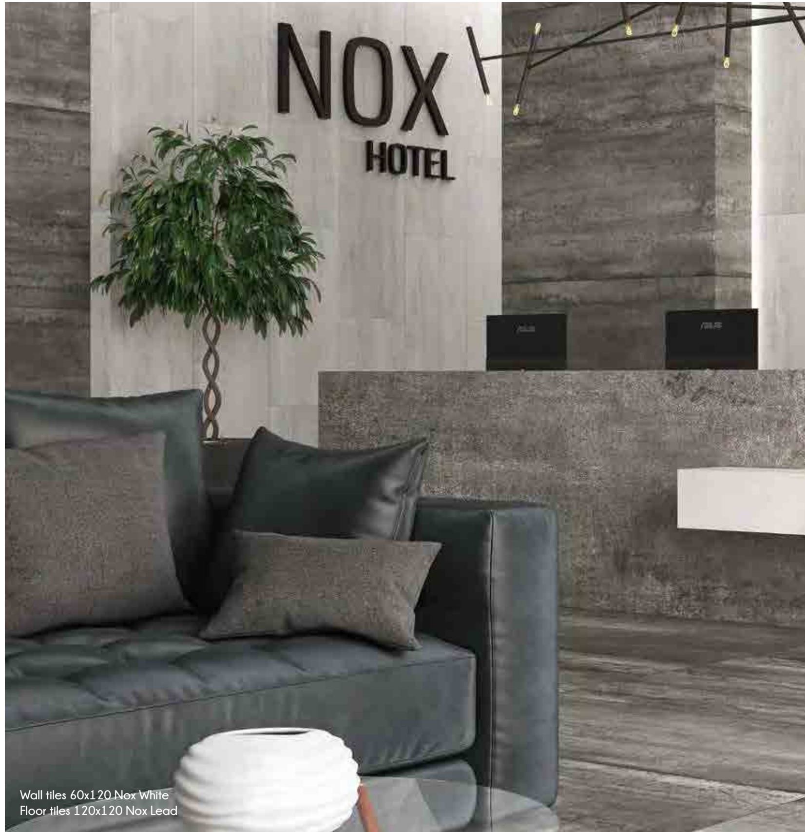
Wall tiles 60x120 Nox White Floor tiles 120x120 Nox Lead