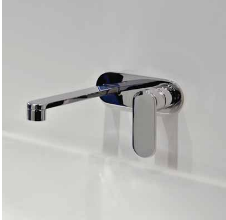
One art. 113058