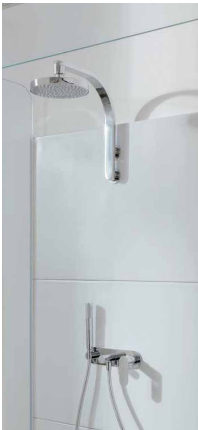
One art. 112550