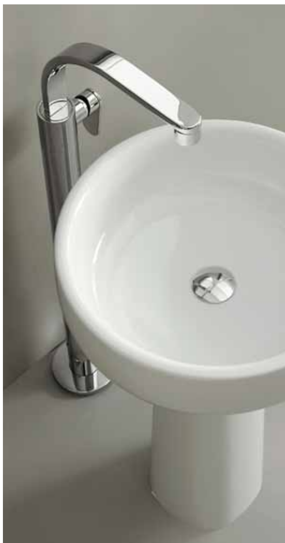
One art. 113052/F