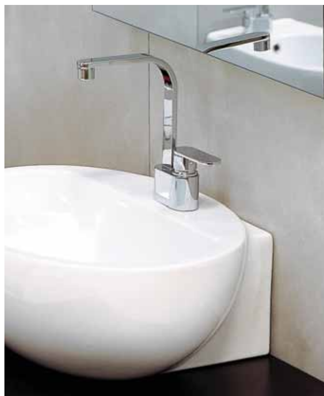
One art. 113055/F