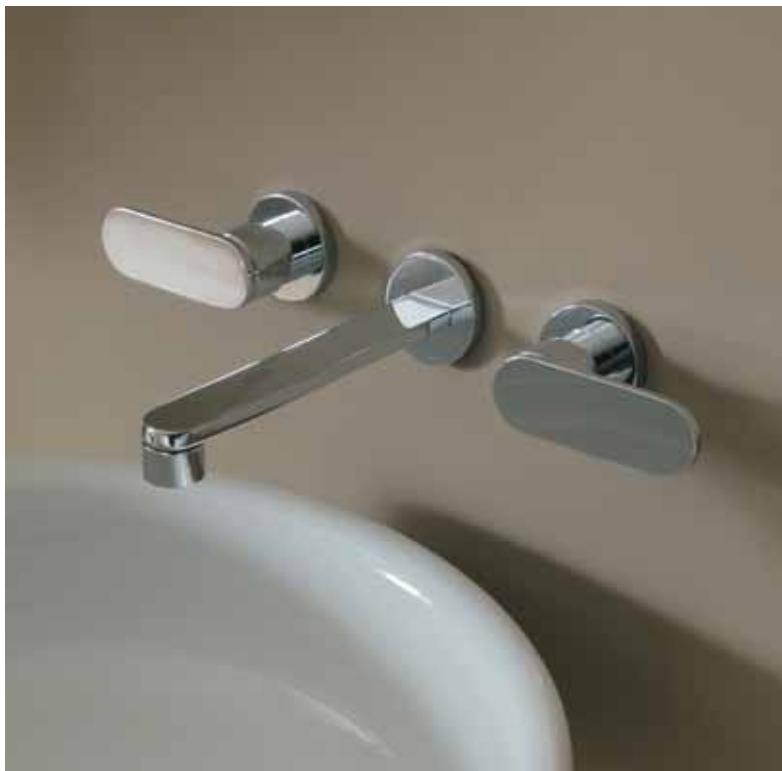
One art. 113060