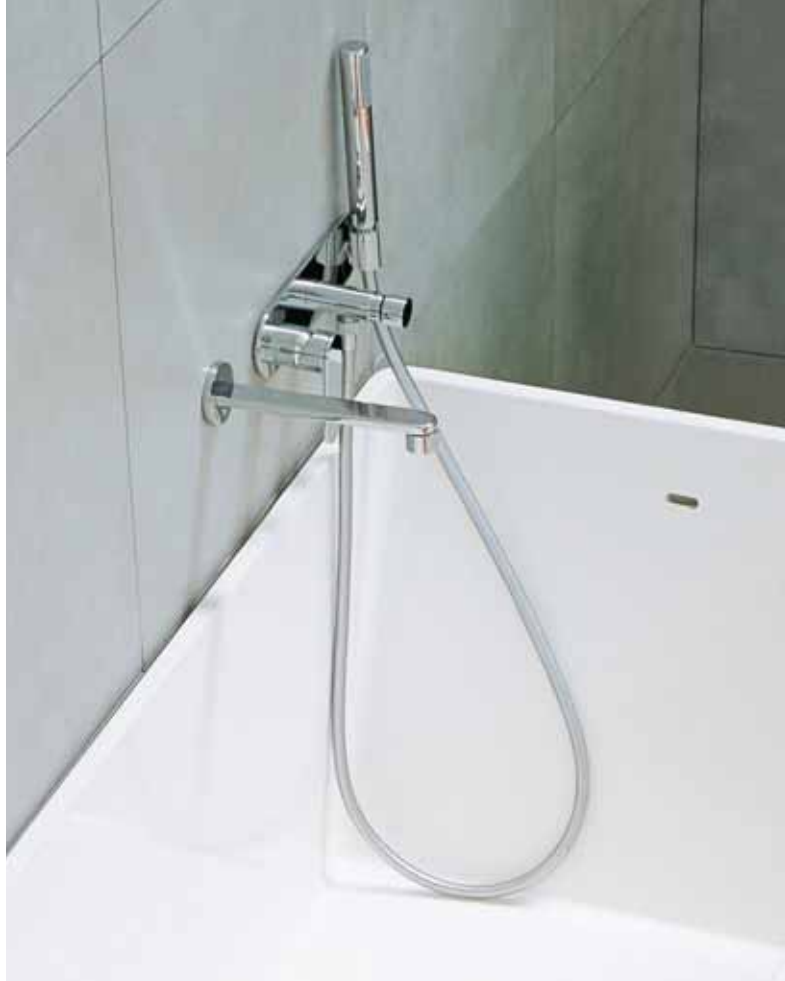
One art. 112570