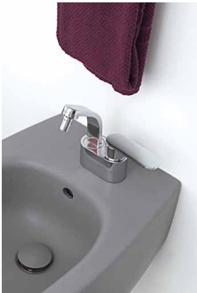
One art. 114070/F