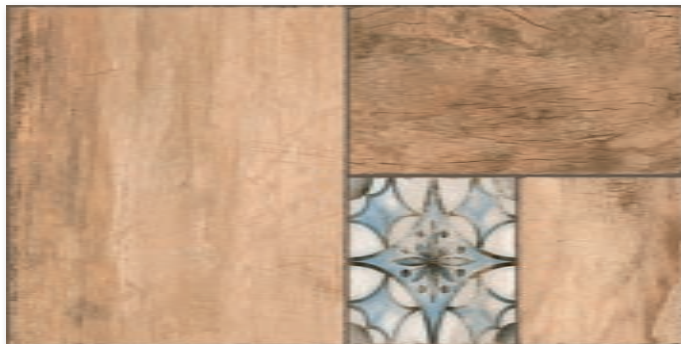
* Patchwood Decor R.029